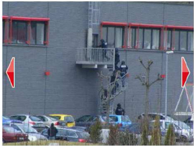
Schwer bewaffnete Polizisten stürmen den Supermarkt über eine hintere Treppe. Ein Leser-Reporter schießt diese Fotos