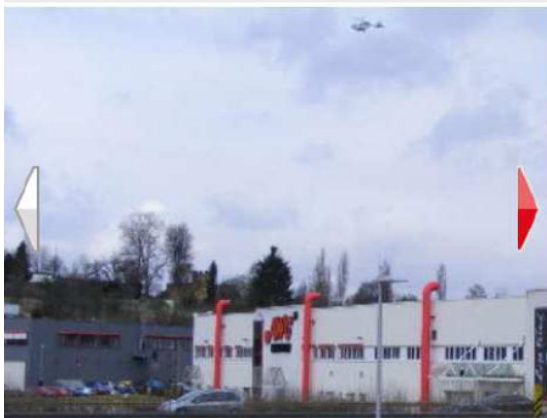
Ein Hubschrauber kreist über dem Gelände