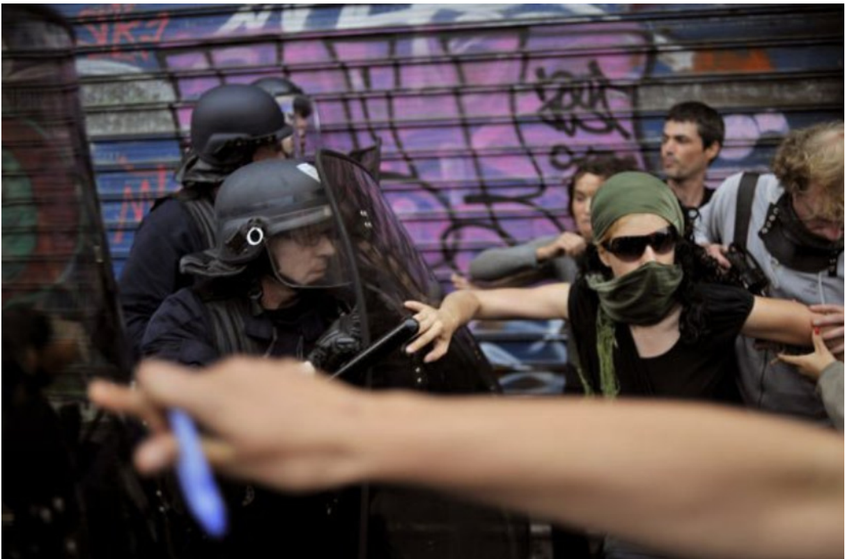
Paris, ca. 14. Juli 2009