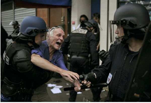
Paris, ca. 14. Juli 2009