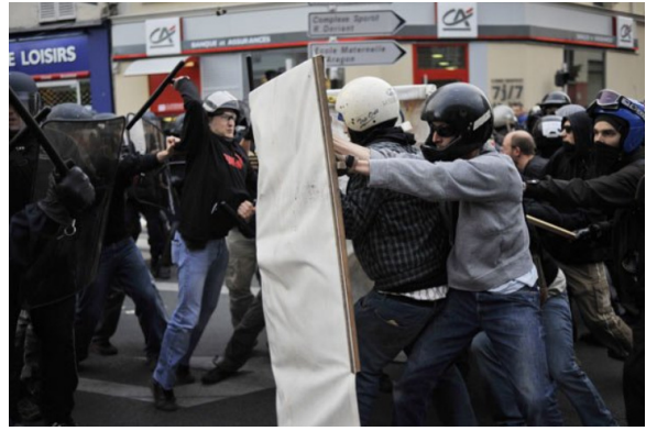
Paris, ca. 14. Juli 2009