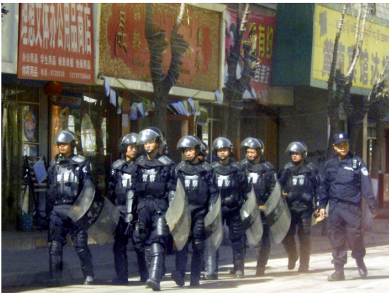
China, Juni/Juli 2009