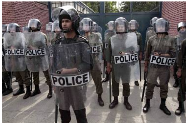
Iran, Teheran Juni 2009