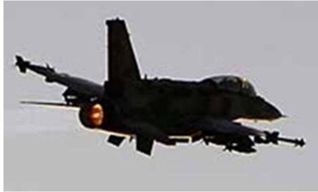
(Israelische Kampffjets vom Typ F-16, 29. 6. 2010)

Bei Daniel Pipes teuflischer Ideologie kann man sehen, dass – R. Steiner hatte es 1919 prophetisch 9 – die Intelligenz böse geworden ist. Er veröffentlichte in der National Post am 29. 4. 2010 folgendes Dogma 10 :