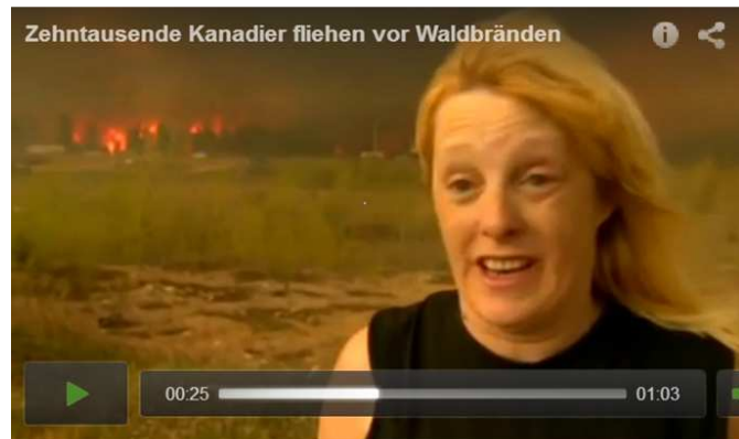
Zehntausende Kanadier fliehen vor Waldbränden

Daß das Wetter manipuliert werden kann , 6 ist nichts Neues. Hinzu kommt, daß die Bevölkerung über die Gefahr, daß der Wind drehen und eine Evakuierung von Fort McMurray anstehen könnte, nicht informiert wurde (s.u.). Als es dann brenzlich wurde musste die Bevölkerung „Hals über Kopf“ fliehen. Diese Frau (s.re.) sagte verzweifelt: 7 Es ist nicht fair: sie haben uns nicht erlaubt, unsere Sachen zu holen. Deswegen haben wir jetzt alles verloren