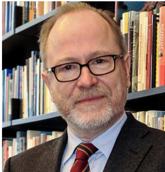
(Jan Philipp Reemtsma 13 , *1952)