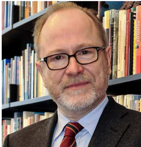
(Jan Philipp Reemtsma 13 , *1952)