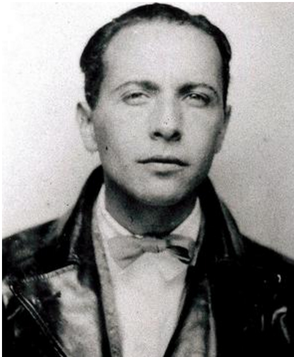
(Louis Aragon, 16 1897-1982)