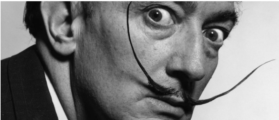
(Salvatore Dali, 10 1904-1989)

(Und Salvatore Dali schreibt:) „Es gibt keine revolutionäre Ordnung, es gibt nur Unordnung und Tollheit “ 9