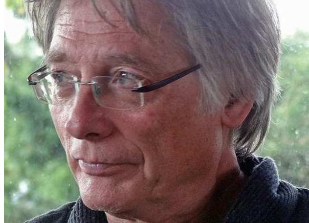
(„Alt-68-er“ Prof. Uwe Sielert 14 )

"Doktorspiele" und forderte Aufklärung: "Ein erziehungspolitischer Skandal lässt sich nicht dadurch aufklären, dass Datenträger eingezogen werden. Aufklärung könnte erst beginnen, wenn die genderpolitischen Ideologien innerhalb des Familienministeriums beseitigt würden, die Empfehlung zu gewalttätiger Sexualerziehung mit Sexualaufklärung verwechseln. Ebenso müssten mehr als 600 000 Leser, gewissermaßen in einer Rückrufaktion, darüber informiert werden, dass der Ratgeber Aufforderungen zu sexuellen