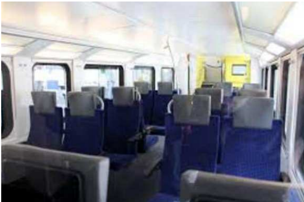
(Salez SG - bewaffneter 27-Jähriger verursacht Brand in Zug : sieben Verletzte. 27 )

Von Feuer sprachen die Presse, der einzige Zeuge, die Polizei (inklusive "Held"), aber die wenigen Bilder zeigen keine deutlichen Spuren von Feuer – auch das von der Polizei veröffentlichte Bild nicht (s.u., diesmal mit blauen Bezügen):