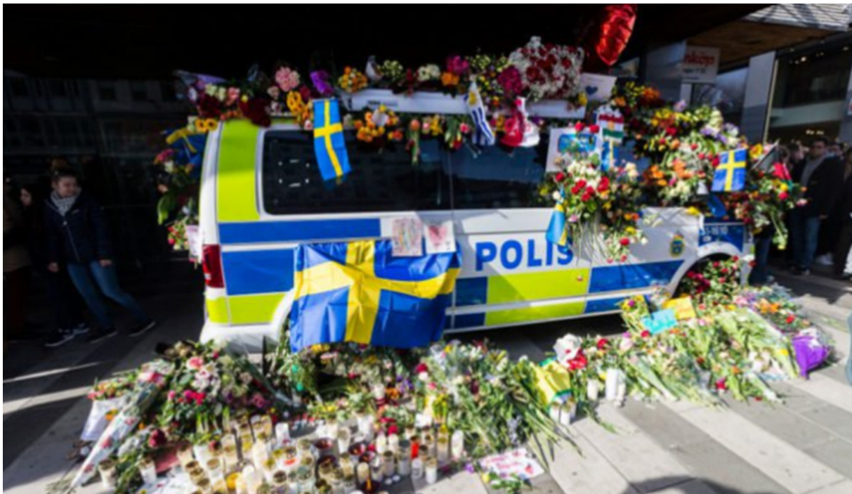
(Schwedisches Polizeiauto zum Gedenken an die Opfer des Lkw-Anschlages in Stockholm mit Blumen 4 )

"Ganz schön abgebrüht", würde man meinen. – Erst ein Massaker mit einem LKW veranstalten, dann mit Zug und Bus nach Hause fahren, um sich gleich darauf ans ... Steuer eines weißen Lieferwagens zu setzen. Man muß ja annehmen, daß Rachmat Akilov – nach der offiziellen Version – gefasst werden wollte, sonst hätte er sich nicht so verhalten. Das Normale wäre nach so einem Verbrechen: man taucht unter, – aber was ist beim Stockholmer Terroranschlag schon normal. Auf jeden Fall "bedankte" sich die Bevölkerung bei der Polizei (s.u.), daß sie den Täter aus Stockholm (offiziell) entkommen ließ und daß sie den abgelehnten Asylbewerber Rachmat Akilov nicht im letzten Sommer abgeschoben hatte. 3 4 Menschen starben beim Anschlag und 15 wurden zum Teil schwer verletzt.