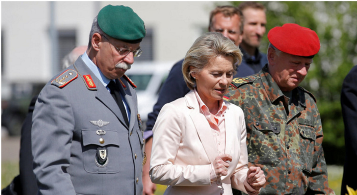
(Bundesverteidigungsministerin Ursula von der Leyen (M) zusammen mit Generalleutnant Joerg Vollmer (L) und Generalinspekteur Volker Wieker (R), im "Quartier Ledere" in Illkirch. 1 )

Im Anfang war die "Räuberpistole aus dem Gebüsch" – ohne diesen offiziellen Fund wäre die Lawine mit unseren Bunderwehr - "Franco" nicht losgetreten und daraus für die CDU-Ministerin von der Leyen eine Erfolgsgeschichte gebastelt worden, weil sie sich termingerecht – im Hinblick auf die Landtagswahlen in Schleswig-Holstein (7. 5.) und NRW (14. 5.) – tagtäglich vor laufenden Kameras "gegen Rechts" positionieren konnte. Natürlich verschwindet die Story mit dem Bunderwehr - "Franco" nach der NRW-Wahl sang- und klanglos aus den Schlagzeilen. 2