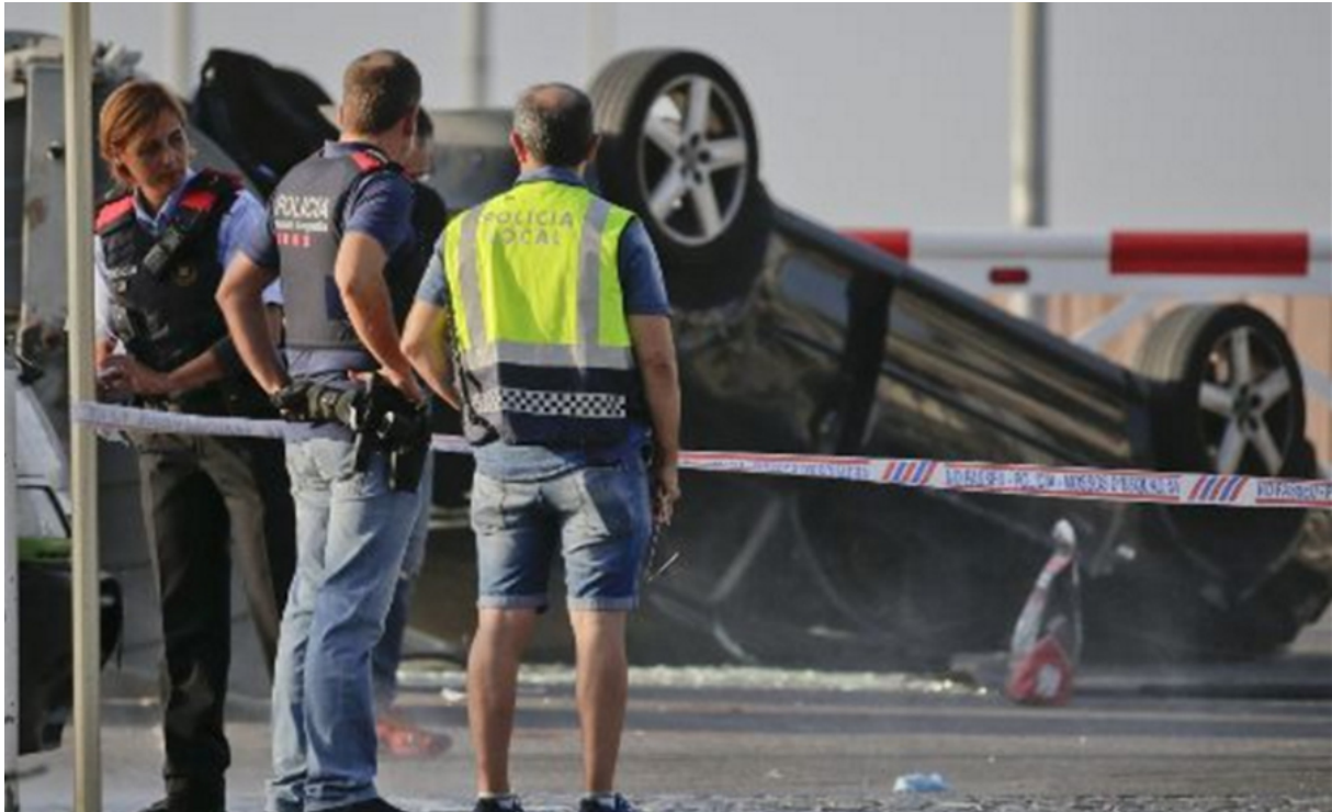
(Das offizielle Terror-Auto in Cambrils: 9 warum liegt es auf dem Dach?)

Bei einer Polizeikontrolle sollen Schüsse gefallen sein – Flüchtige hätten sich so der Kontrolle entziehen wollen. Ein Verdächtiger soll laut dem Fernsehsender TV-3 erschossen worden sein. 8 Wer ist dieser Verdächtige und warum wurde er erschossen?