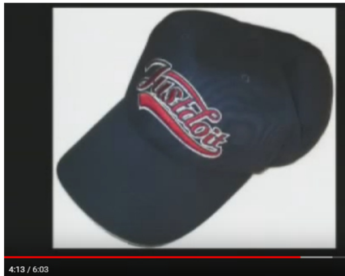
Anna Lindh-mordet - "Någon är skjuten på NK" - Krimarkivet (TV4) 3

Man braucht sich daher nicht zu wundern, daß Mijailovics Mütze in eben diesen drei Farben der Trikolore gestaltet ist. Die Trikolore tauchte erstmals 1790 in der Revolutionszeit auf ... Am 15. Februar 1794 wurde die