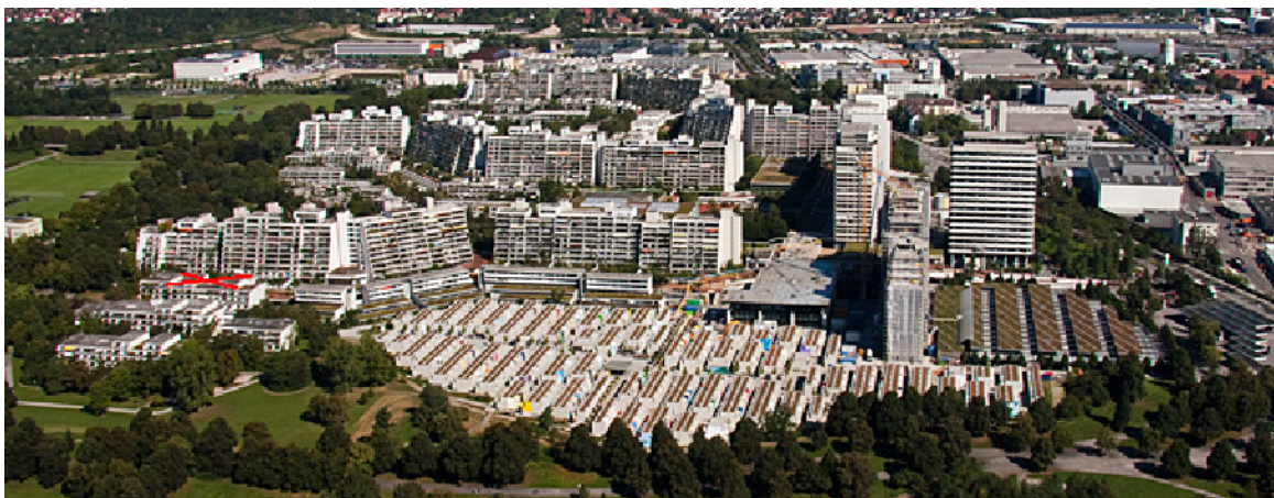
(Das olympische Dorf. In der Connolly 11 -Straße 31 [rotes X] gastierte die israelische Mannschaft [vgl.u.]

Weiter heißt es in dem Video: (Sprecher:) Die friedliche Ruhe im olympische Dorf (s.u.) 10 darf keinesfalls gestört werden. (Oder: durften die Terroristen in ihren Vorhaben nicht gestört werden? Frage 17)