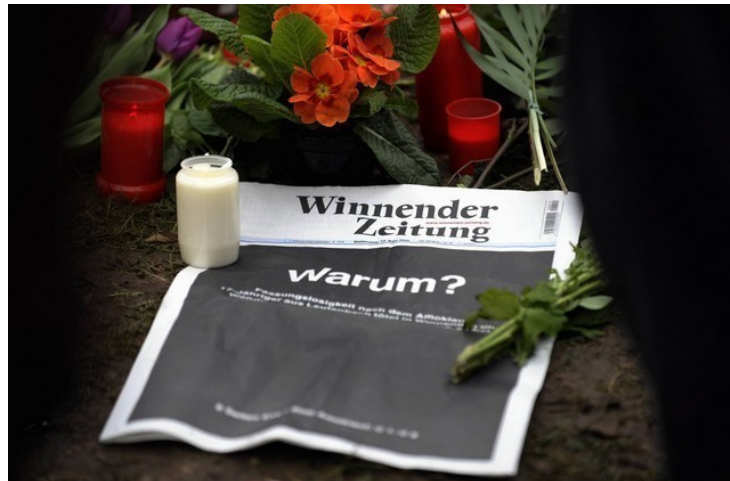
(Linkes Bild: „Warum“-Schild in Apeldoorn 4 [warum heißt auf niederländisch „waarom“]. Rechtes Bild: „Warum“-Logen-Zeitung in Winnenden nach dem 11. 3. 2009)