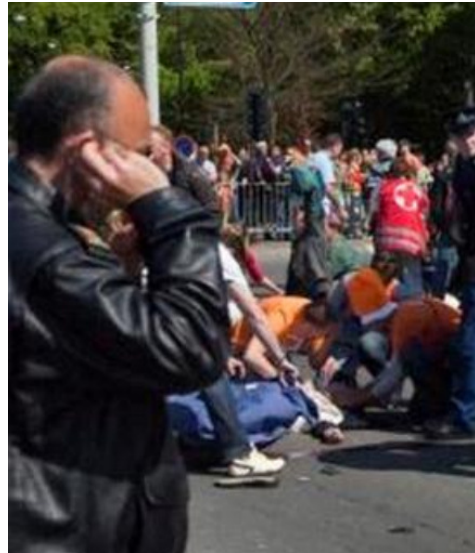
(Verletzte und Tote [?] nach dem okkulten Verbrechen vom 30. 4. 2009 in Apeldoorn)