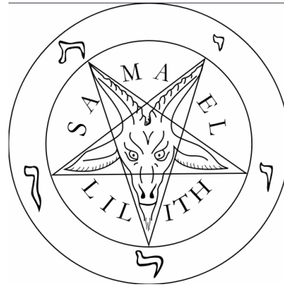
Pentagramm als Satanszeichen