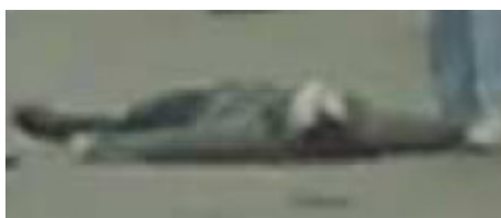
(Person mit Halbglatze)

Hier noch zwei Vergrößerungen der beiden am Boden liegenden Personen im Vergleich (die zwei letzten Bilder):