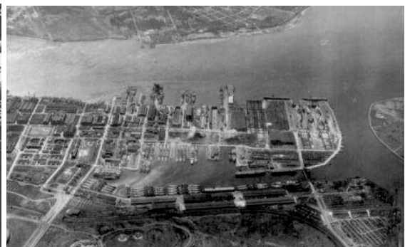
(Hafen von Philadelphia)