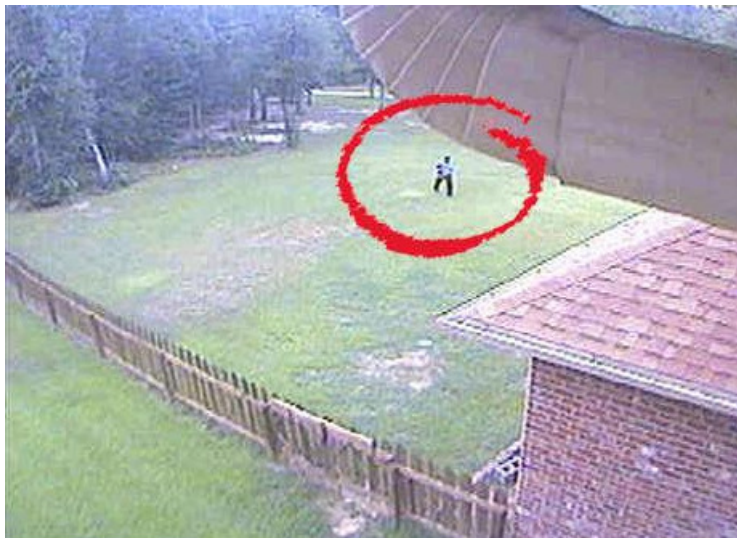
Die Überwachungskamera zeigt einen der verummten Gangster, der aufs Haus zuläuft