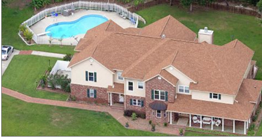
Haus der Opfer: "Es ist unvorstellbar"