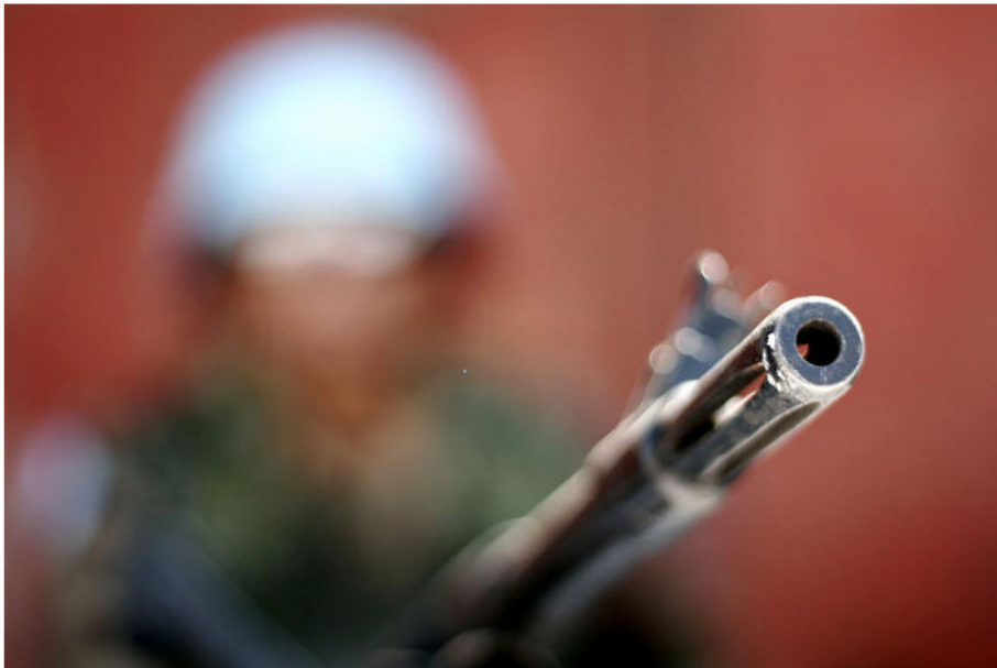
Ein Soldat der UN-Friedenstruppe in Port-au-Prince (Haiti)

In Port-au-Prince, Haiti, ist ein UN-Soldat erschossen worden. In dieser Woche war es bereits zu mehreren Zusammenstößen von Demonstranten mit UN-Soldaten gekommen.