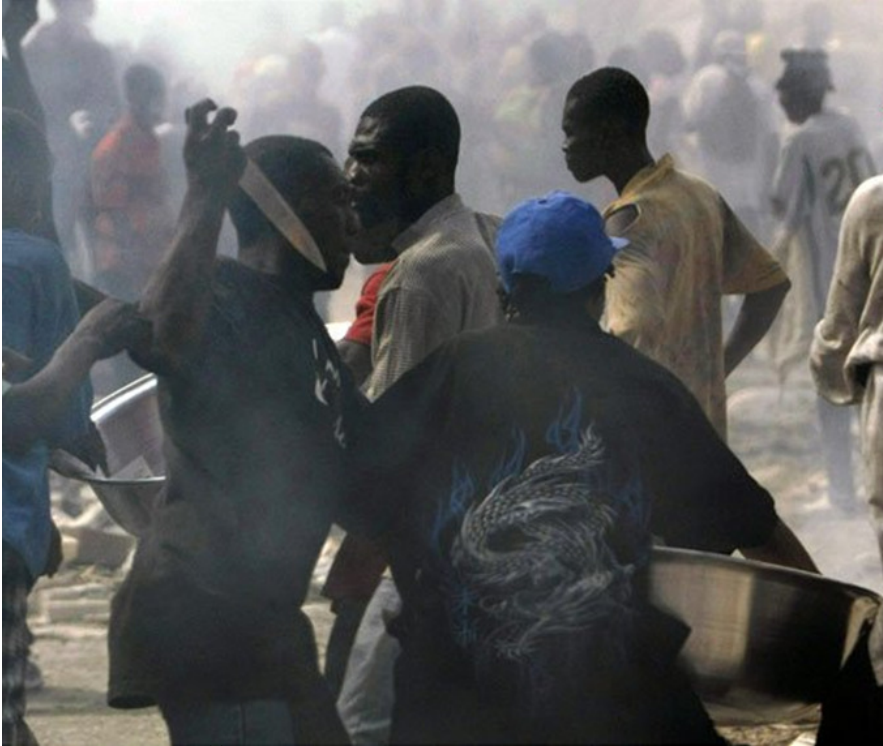
(Text darunter 11 : Überlebende bei Kämpfen in Haitis Hauptstadt Port-au-Prince )

Nach den ZDF-Nachrichten vom 18. 1. 2010 (19:00) – sechs Tage nach dem Erdbeben – rollt die seit Tagen versprochene Hilfe nun über die Grenze von der Dominikanischen Republik an (vgl. Artikel 193). Die US-Amerikaner haben – so die Nachrichtensprecherin – ... seit 48 Stunden (16. 1. 2010) den Flughafen von Port-au-Prince (völkerrechtswidrig) besetzt und nur US-amerikanischen Fliegern eine Landeerlaubnis erteilt . Der frühere US-Präsident Clinton kam auch schon „eingeflogen“, um die „Lage zu erkunden“.