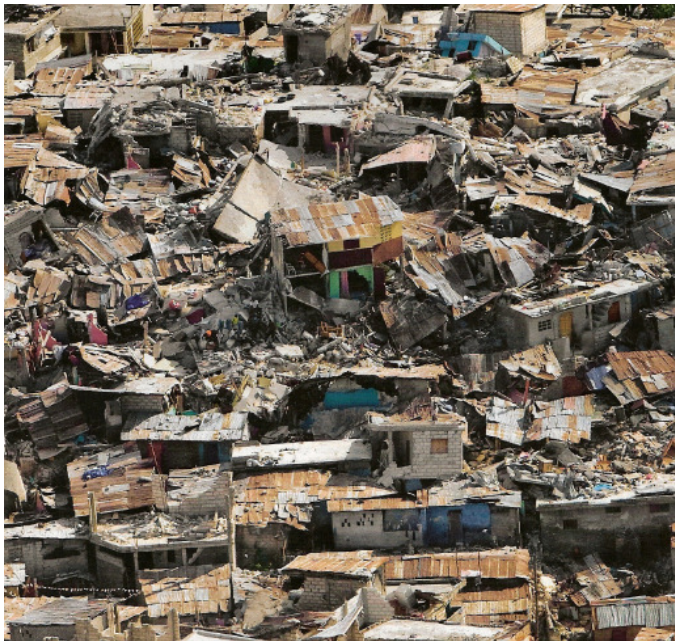
(zerstörte Slum-Baracken in Port-au-Prince)

Hinzu kommt, dass jede neue Waffe (vgl. Atombombe) wiederholt an Menschen erprobt wird, um sie für weitere Einsätze effektiver zu machen, und um sie in die gesamte militärische Planung zu integrieren. So ist auch davon ist auszugehen, dass die „Erdbeben-Waffe“ HAARP in Haiti am 12. 1. 2010 „mit Erfolg“ experimentell eingesetzt wurde – im Hinblick auf den letzten Weltkrieg dieser Zivilisation, den Krieg zwischen NATO und Anti-NATO (= SOC 3 ).