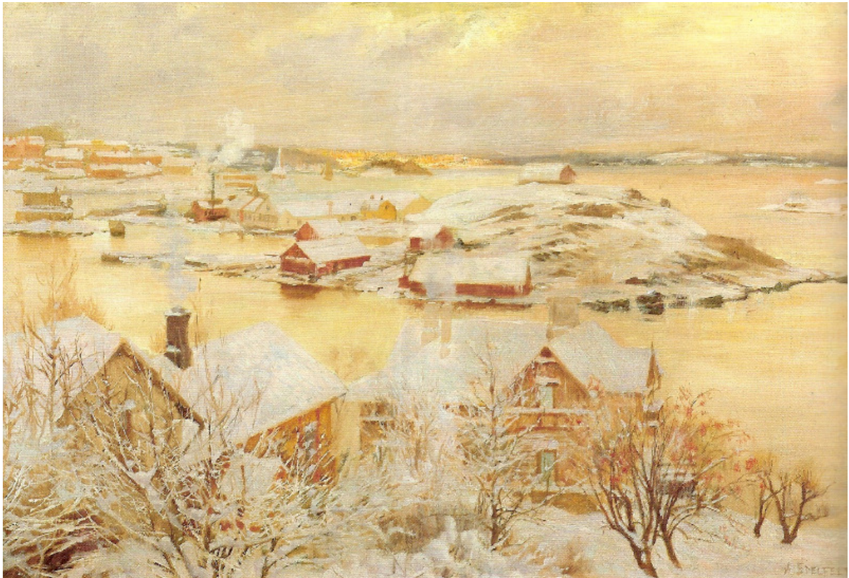
(Albert Edelfelt Dezembertag , 1893)

Giovanni Gabrieli (1557-1612) - Canzon a 8 voci in due cori & in echo Chiese (1608) 10