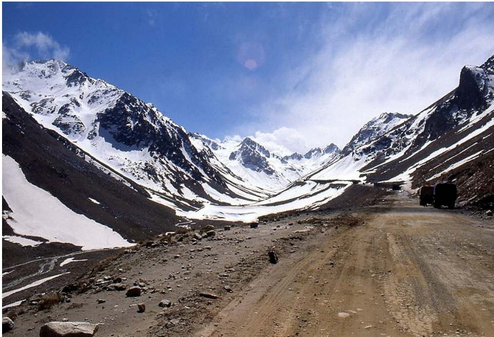
(Der Salang-Pass auf ca. 3400 m Höhe)

Der Salang-Pass in Afghanistan verbindet die Hauptstadt Kabul mit dem Nordwesten des Landes und der Stadt Mazar-i-Sharif. Auf rund 3400 Metern Höhe befindet sich der Salang-Tunnel (2,6 km). Der Salang-Tunnel ist der dritthöchste Straßentunnel der Welt, bis ins Jahr 1973 führte er die Liste der höchsten Straßentunnel der Welt an. 1955 unterzeichnete Afghanistan mit der Sowjet Republik einen Vertrag zum Bau dieses Tunnels, der 1964 fertiggestellt wurde und eine ganzjährige Verbindung zwischen Nord und Süd ermöglicht 2 .