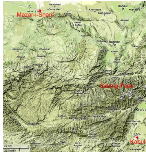
(Der Salang-Pass zwischen Kabul und Mazar-i-Sharif)

te weitere steckten aber noch in eisiger Kälte in ihren Fahrzeugen fest. Ein Schneesturm hatte am Montagabend an dem in 3800 Meter Höhe gelegenen Salang-Pass eine Serie von Lawinen ausgelöst, die einen Straßenabschnitt von 3,5 Kilometern Länge unter sich begruben. Hunderte von Fahrzeugen wurden dabei verschüttet. Zahlreiche Menschen sitzen im Salang-Tunnel fest , dessen Ausgänge durch die Schneemassen blockiert wurden.