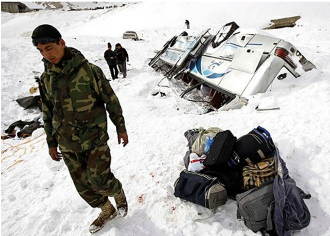
(Text 4 : Ein Reisebus wurde verschüttet.)

te weitere steckten aber noch in eisiger Kälte in ihren Fahrzeugen fest. Ein Schneesturm hatte am Montagabend an dem in 3800 Meter Höhe gelegenen Salang-Pass eine Serie von Lawinen ausgelöst, die einen Straßenabschnitt von 3,5 Kilometern Länge unter sich begruben. Hunderte von Fahrzeugen wurden dabei verschüttet. Zahlreiche Menschen sitzen im Salang-Tunnel fest , dessen Ausgänge durch die Schneemassen blockiert wurden.