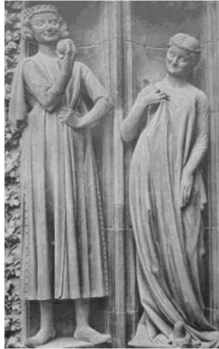
(Anti-Christ und törichte Jungfrau, ebenda)

Rechenschaft zu fordern. Unten im Tempel waren die Weherufe als Anti-Seligpreisungen erklingen. Jetzt mündet der Tag in eine erhöhte Bergpredigt ein. Mit der letzten intimsten Unterweisung gibt der Christus den Jüngern eine Mutausrüstung auf Jahrtausende hin. Die Wiederkunftsgleichnisse und ganz besonders auch die Schlußvision von der Scheidung der Geister in Schafe und Böcke, in die die ganze Ölberg-Apokalypse einmündet, sind eine Wegzehrung für die Jünger auf viele Inkarnationen hinaus. Das Licht der Apokalypse, das die hereinsinkende Nacht durchhellt, ist die dem Mars abgerungene Sonnengabe.