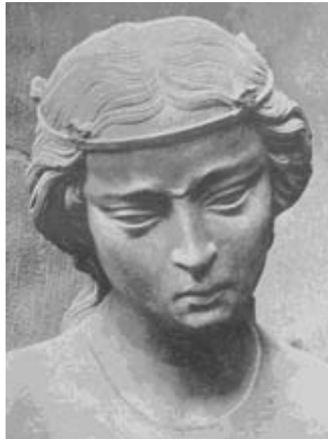
(Anti-Christ und törichte Jungfrau, beide mit dem „Zeichen des Tieres“ [666-Mikrochip] zwischen den Augenbraunen, Straßburger Münster)

Die Antwort, die Jesus auf die Zinsgroschenfrage gibt, zeigt, wie sich der wahre, durch innere Arbeit erlangte Mut bewährt. Wer auf gesunde Weise nach dem Geiste strebt, entfremdet sich der Erde nicht, sondern weiß das Gleichgewicht zwischen irdischen Pflichten und geistigen Idealen einzuhalten und erringt gerade dadurch die Souveränität über alles Irdische. Er kann, selbst wenn, wie in jenen Tagen, ein wildes Tier auf dem Throne sitzt, sagen: »Gebt dem Cäsar, was des Cäsars ist, und Gott, was Gottes ist.«