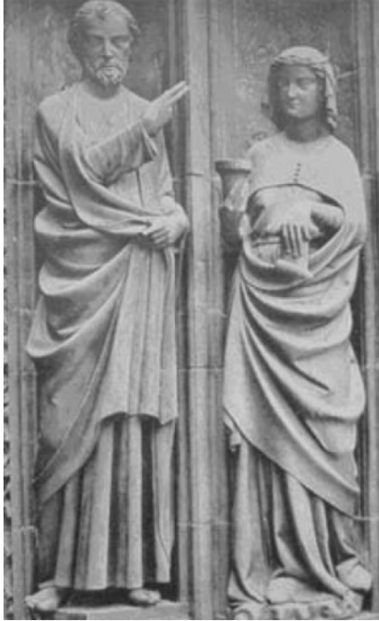
(Christus und kluge Jungfrau, Straßburger Münster)