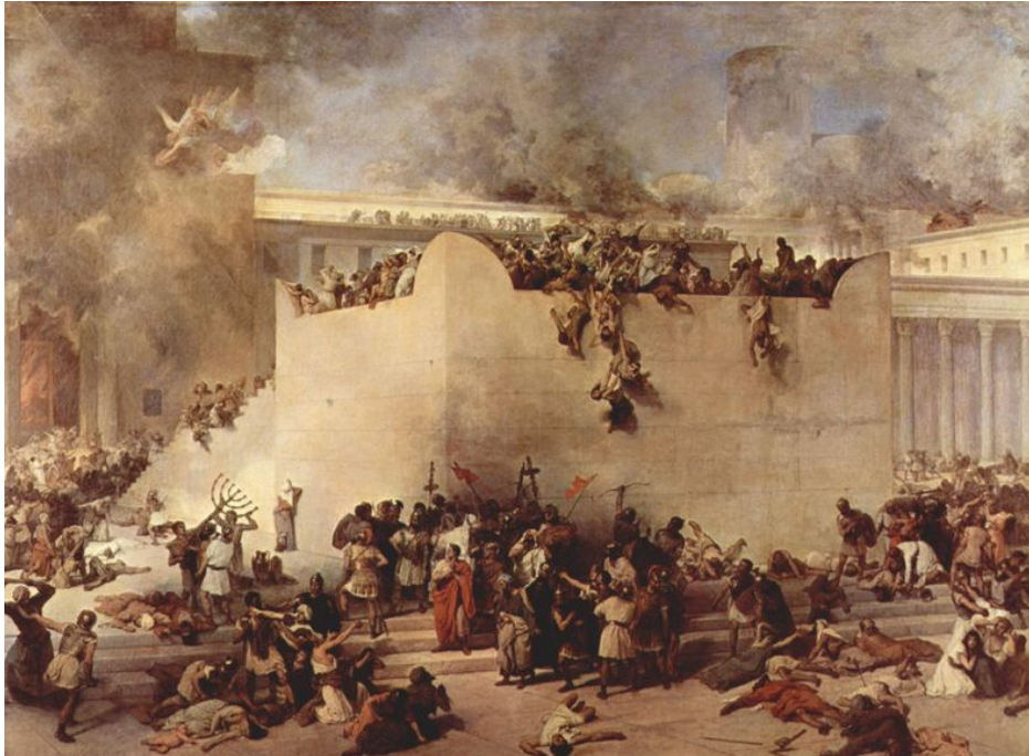
(Die Zerstörung des Tempels in Jerusalem, ca. 70 n. Chr.)

Und es kommt so viel herein, wie am Tage echte innere Kraft aufgewendet worden ist. Die Gegenwart wird durchsichtig. Die Jünger haben mit dem Christus den Tag über im Anblick des Tempels geweiht. Es hat sich gezeigt: Dies alles ist dem Untergang geweiht. Die Zerstörung Jerusalems und des Tempels ist eine geistige Notwendigkeit. Wäre sie nicht vier Jahrzehnte später durch die Römer vollzogen worden, so hätte sie auf eine andere Weise herbeigeführt werden müssen. Durch die aufsteigende Vision vom Tempeluntergang scheint die Schau einer großen kosmischen Katastrophe hindurch. Eine ganze Welt geht unter.