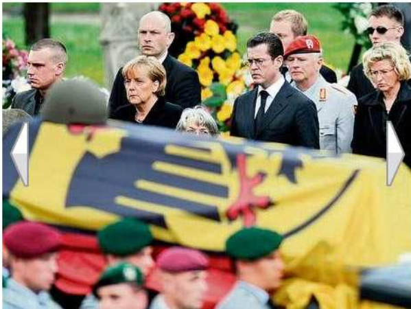
Deutschland nimmt Abschied: Kanzlerin Angela Merkel und Verteidigungsminister Karl-Theodor zu Guttenberg vor den Särgen

VERTEIDIGUNGSMINISTER UND KANZLERIN MERKEL ERWEISEN DEN DREI IN AFGHANISTAN GETÖTETEN SOLDATEN DIE LETZTE EHRE