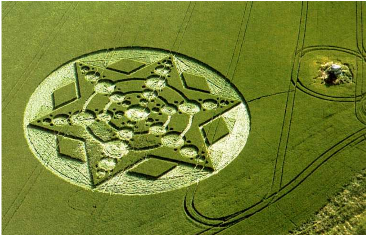
(Gralsmacht-Kornzeichen, Sechsstern neben Druidenstein , 19. 7. 1999, Devils Hill, England)