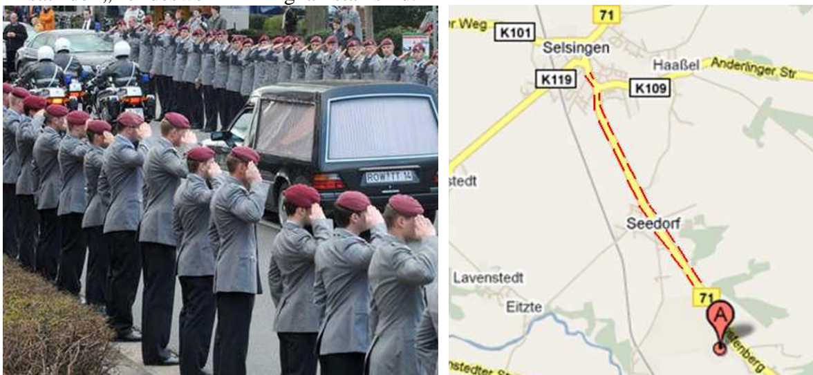
(Text 5 : Das Spalier reicht von der St. Lamberti-Kirche bis zur Kaserne in Seedorf [das sind über 4 km!])

Das alles – wohl wissend – dass rund 80% der Bürger unserer Bananenrepublik gegen den Einsatz der „Bundeswehr“ in Afghanistan sind.