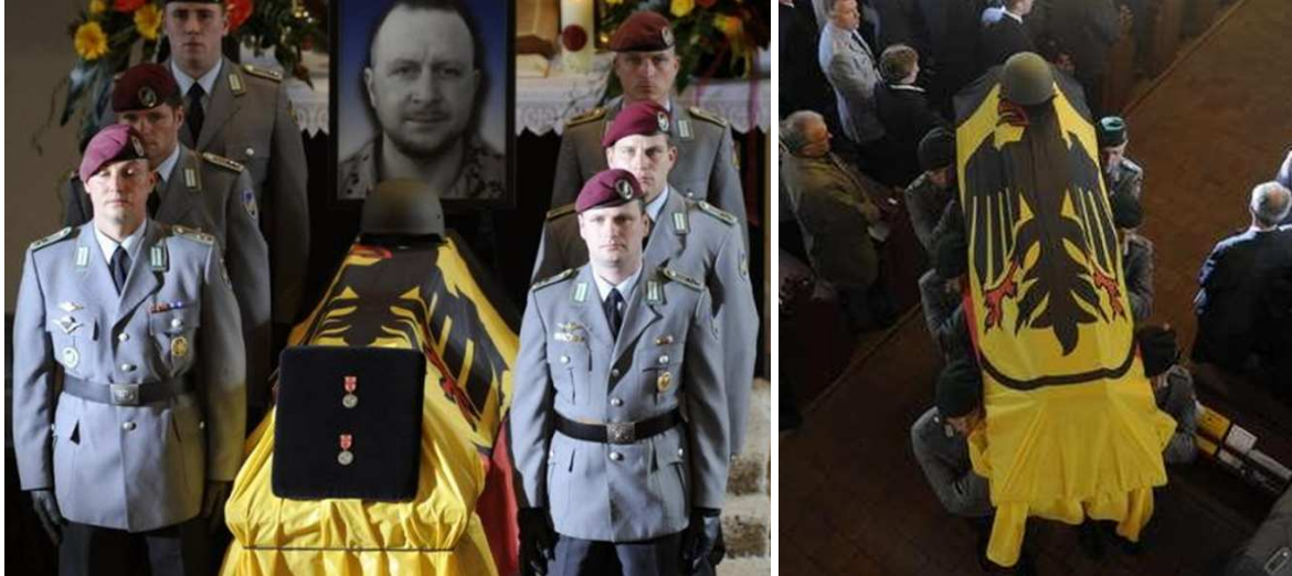
(Bei jedem der drei Säрге stehen 6 „Soldaten“, also: 666 )