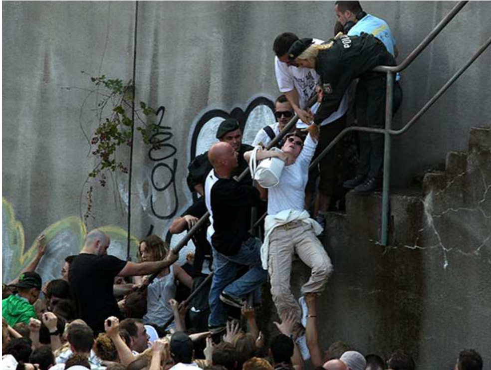
(Hier wurde versucht, eine kollabierte Frau über die berühmte Treppe links der Haupttrampe zu retten)

Frage 57: Vielleicht sollte man lieber von Massen-Notwehr sprechen?