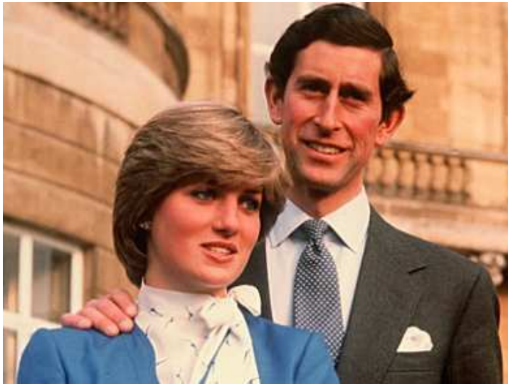
(Prinzessin Diana und Logen-„Bruder“ Prinz Charles)

„Ich sah einen Wagen im Rückspiegel, bei dem die Scheinwerfer aufleuchteten. Ich fuhr zur Seite, um ihn vorbeifahren zu lassen, obwohl ich etwa 70 Meilen die Stunde fuhr. Einen Augenblick später hörte ich einen ohrenbetäubenden Lärm, und dann sah ich den Unfall. Der Wagen rutschte auf der Fahrbahn hin und her. Es befanden sich keine anderen Fahrzeuge in der Nähe, und ich konnte den gesamten Tunnel übersehen. Das Dach des Mercedes war total eingebault. Die rechte Hintertür stand zum Teil offen. Ich sah hinein und sah eine Frau. Anscheinend war sie vom Rücksitz nach vorn geschleudert worden. Ihr Kopf befand sich zwischen den Vordersitzen.“ 9