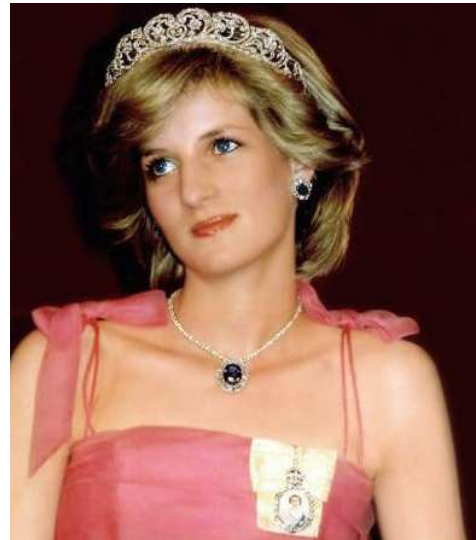
(Prinzessin Diana 1961-1997)