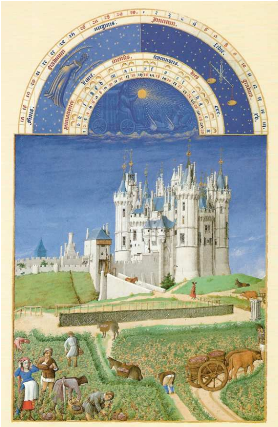
(Brüder von Limburg, September , aus dem Stundenbuch des Herzogs von Berry)