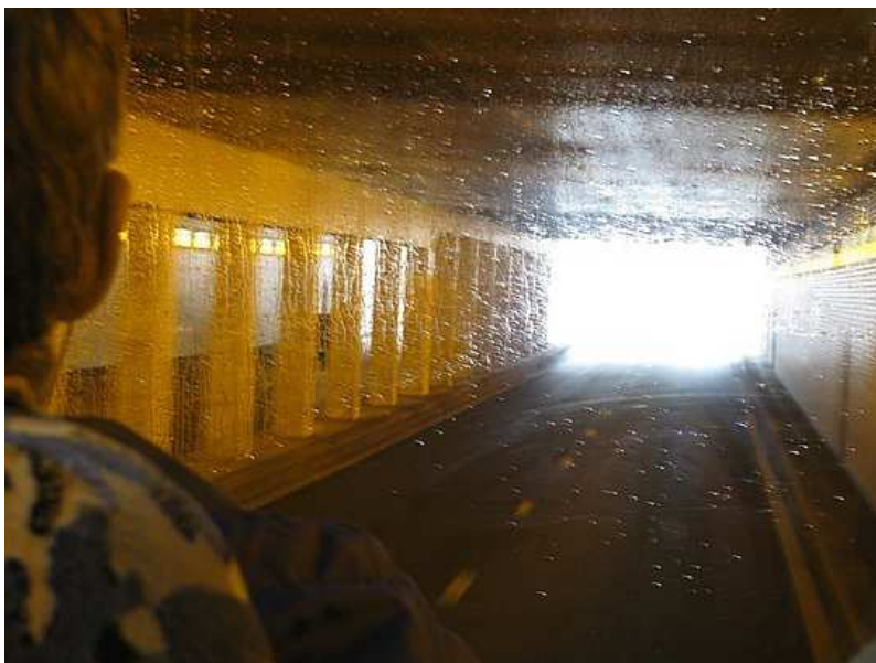
(Der Tunnel Pont de L'Alma, links die Pfeilerreihe)

Ist es möglich, dass Dianas Wagen auf diese Weise von außen gesteuert wurde? Denn es ist