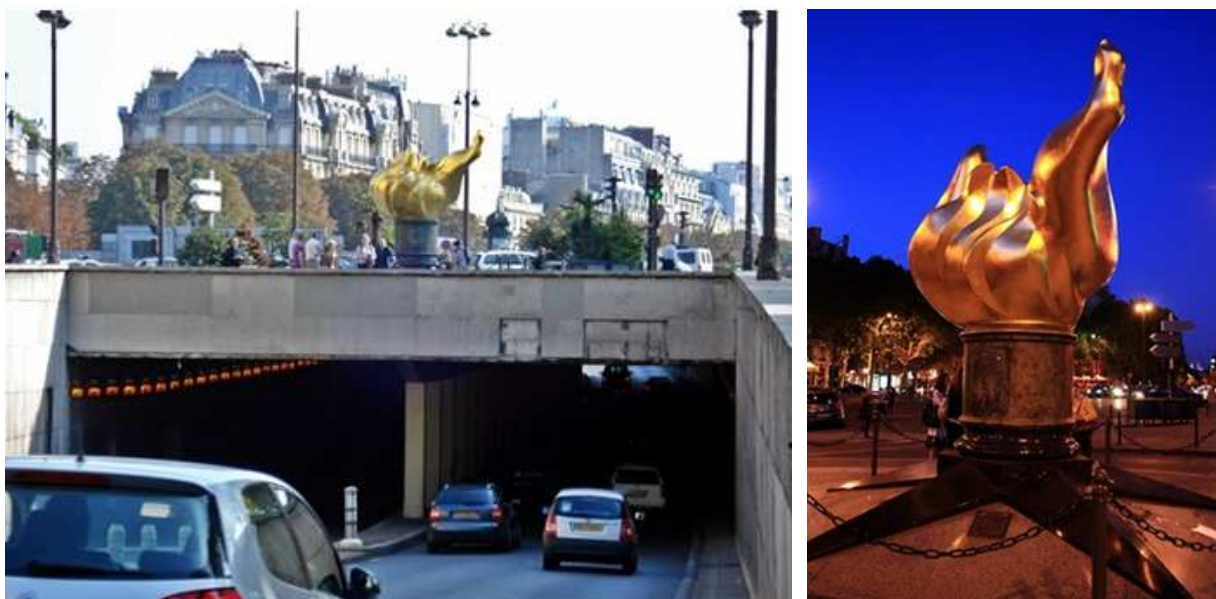
(Der Tunnel Pont de L'Alma mit dem „Diana-Denkmal“ – die Sieg-Sorat-Flamme der Logen-„Brüder“)