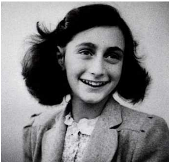
(Anne Frank, 1929-1945)

Das Mädchen und die Frau, in ihrer neuen, eigenen Entfaltung, werden nur vorübergehend Nachahmer männlicher Unart und Art und Wiederholer männlicher Berufe sein. Nach der Unsicherheit solcher Übergänge wird sich zeigen, dass die Frauen durch die Fülle und den Wechsel jener (oft lächerlichen) Verkleidungen nur gegangen sind, um ihr eigenstes Wesen von den entstellenden Einflüssen des andern Geschlechtes zu reinigen.