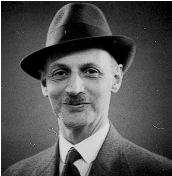
(Otto Frank, 1889-1980)

1951 – Einführungsjahr des Kugelschreibers«, mußte 1980 in einem Bericht über den Prozeß selbst das Hamburger Nachrichtenmagazin „Der Spiegel“ einräumen. 8