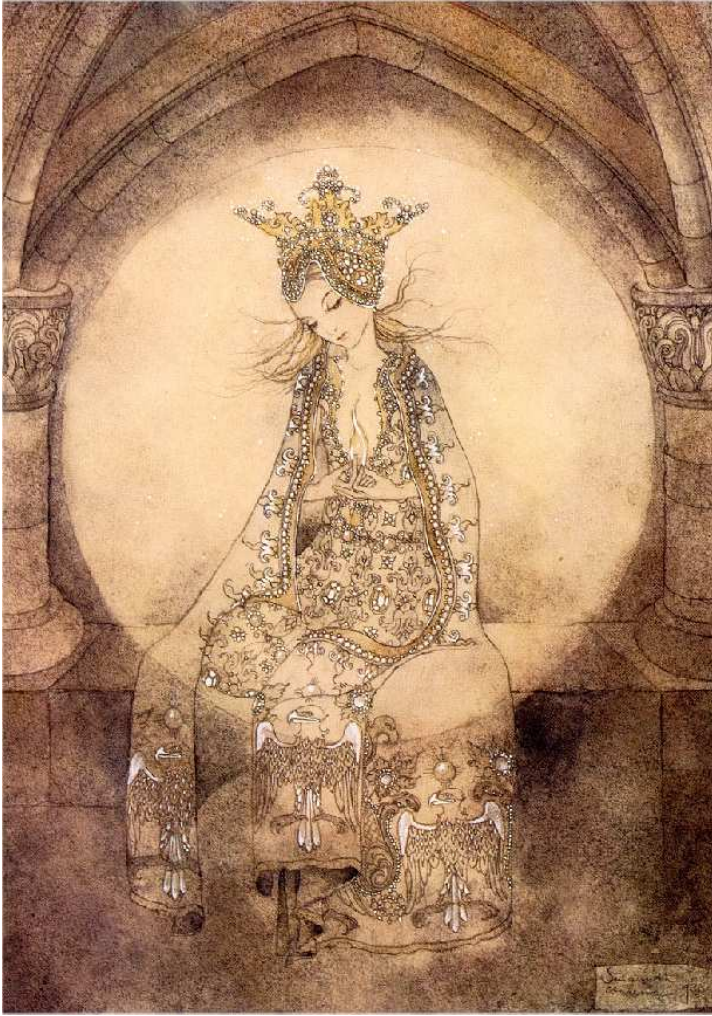
(Sulamith Wülfing, Das Geschöpf )