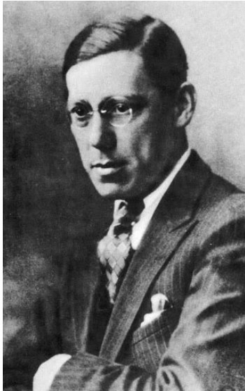
(Joseph Hieronim Retinger)

polnischen Exilregierung und Oberbefehlshaber der polnischen Truppen. Der bei einem mysteriösen Flugzeugabsturz getötete Wladyslaw Sirkowski , Joseph Retinger , Karol Wojtyla (alias Papst Johannes Paul II. ) und Zbigniew Brzezinski (erster Vorsitzender von Rockefellers <Trilateraler Kommission>) bildeten in der Geschichte der supranationalen Bewegung eine mächtige polnische Achse , die, gewollt oder ungewollt, wesentlich dazu beitrug, Deutschland global einzubinden und vor allem dessen berechnete Forderungen nach Rückgabe der von Polen okkupierten Ostgebiete bis heute im Keim zu ersticken.