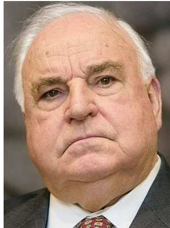
(„Bruder“ Helmut Kohl)