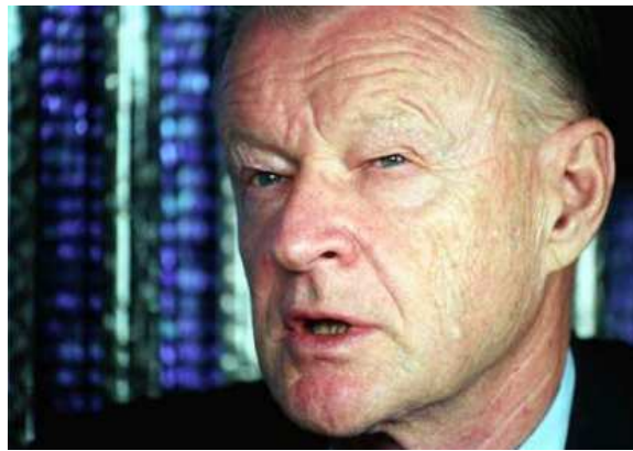
Pole Karol Wojtyła (Papst Johannes Paul II.) (Pole „Bruder“ Zbigniew Brzezinski)