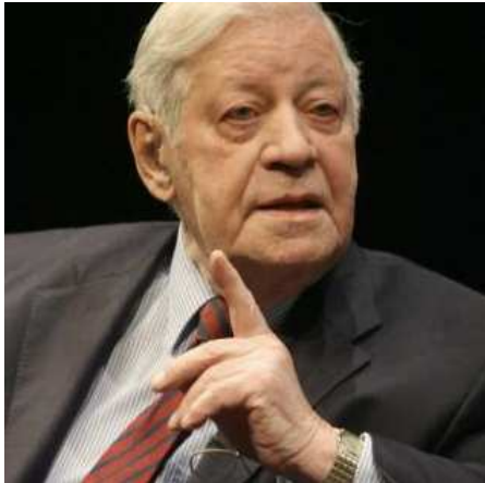
(„Bruder“ Helmut Schmidt)

Helmut Kohl (CDU) ist/war <Bilderberg>-Teilnehmer, Mitglied der DGAP, höchster Preisträger der jüdischen Loge B'nai-B'rith und Coudenhove-Kalergie Preisträger.