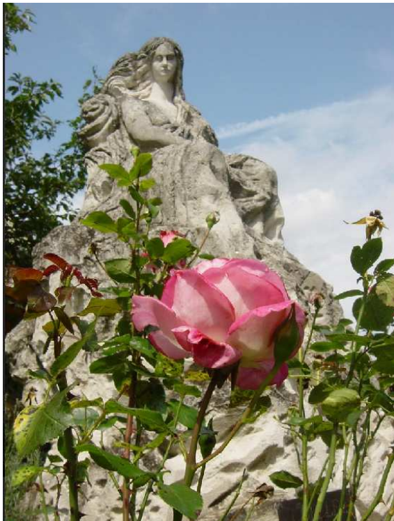
(Loreley-Skulptur auf dem Felsen)

Bekannt ist die Loreley und durchaus besungen 11 – aber natürlich auch „gefährlich“: