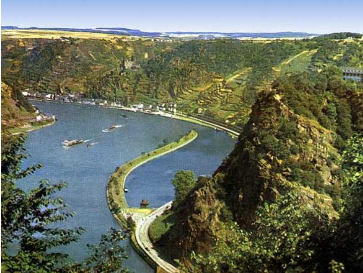
(Rechts der Loreleyfelsen)

Gibt man in Google die Begriffe „Rhein“, „Schwefelsäure“ und „2300“ ein, dann gibt es nicht wenige Logen-Medien, die das Tankschiff mit 2300 Tonnen Fracht angeben – warum wohl?