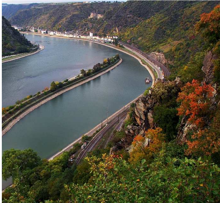
(Bild des havarierten Schiffstankers vom Loreleyfelsen oben. Bild auf die Stelle und St. Goarshausen vom Loreleyfelsen unten [ohne Schiffstanker])

Könnte es sein, dass die Logen-„Brüder“ der Loreley (– bei all ihrer Verachtung gegenüber dem Weiblichen 9 –) eine Art „Sündenbock“-Funktion zudachten? 10