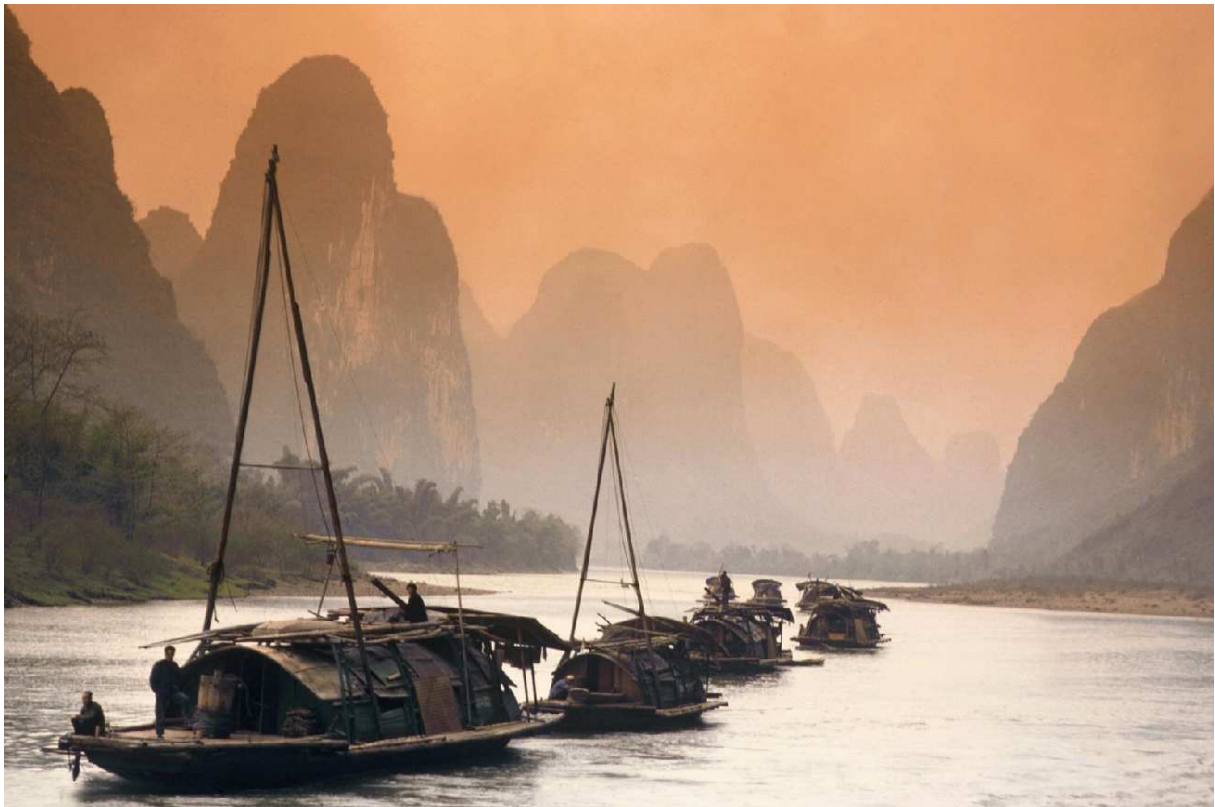
(China: Dschunken auf dem Yiang-Fluss)

Antioch Chamber Ensemble - Jesu, as Thou art our Savior - Benjamin Britten 20