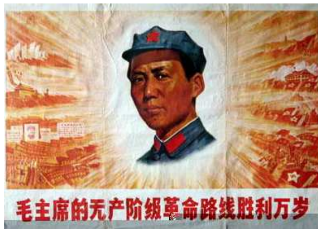
(„Gott“-ähnliche Verherrlichung von Mao Zedong in China)

Bei meinen Recherchen über Mao stieß ich bei den Begriffen „mao zedong freemason“ 2 in Google auf folgende englischsprachige Internetseite 3 mit dem überraschenden Inhalt: Im Jahr 1903 hatte die „Yale Divinity School“ eine Reihe von Schulen und Krankenhäusern in ganz China gegründet, die zusammen waren bekannt als „Yale in China“ ... Einer von „Yale in China“ bedeutsamsten Studenten war Mao Zedong. 4