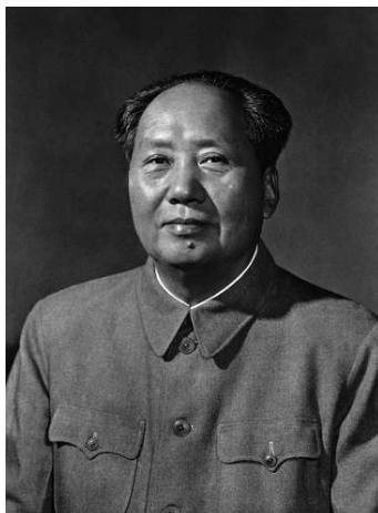
(Mao Zedong, 1893 – 1976)

Offiziell hat der Kommunist Mao Zedong wie kein anderer das China des 20. Jahrhunderts geprägt – mit welcher Zielsetzung? Und: welchen Einflüssen war er ausgesetzt?