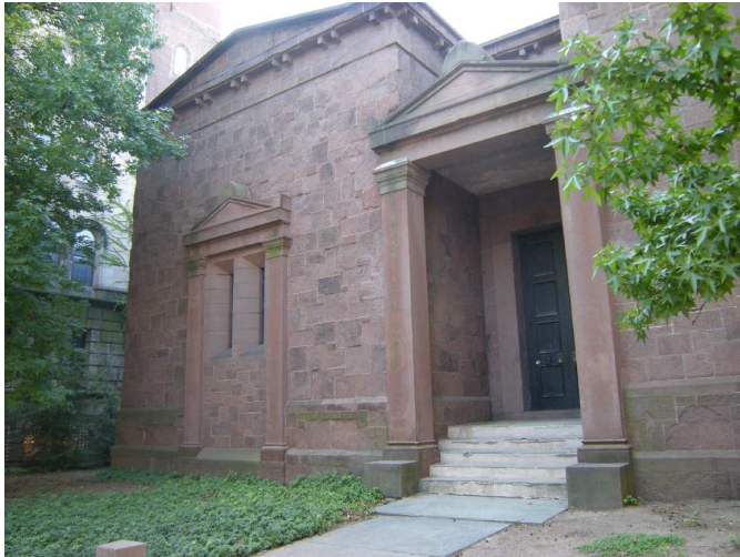
(The „Tomb“ [„Grab“/„Gruft“] auf dem Gelände der Yale-University)

»Aus diesen schwierigen Zeiten heraus kann, das ist unser fünftes Ziel – die Neue Weltordnung erwachsen ... Wir haben jetzt eine UNO im Visier, die so arbeitet, wie es sich ihre Gründer (d. h. CFR/ Rockefeller ...) vorgestellt haben.«