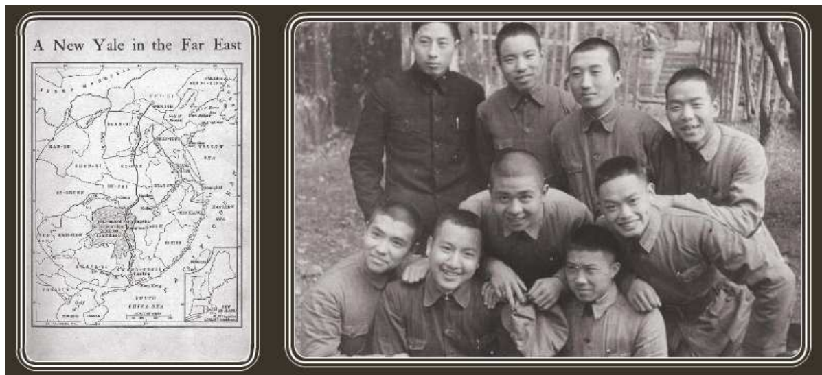
( New Yale in far East 14 , Bild 2 15 ) (Unter Bild 11 [ebda] steht: Yali Middle School students in the 1930s . [dt: “Yali Mittelschule Studenten in den 30-er Jahren”])

Kommen wir auf Mao Zedong und Yale in China (s.o.) zurück. Es gibt eine Internetseite von Yale in China oder Yale-China 12 . Unter Bild 1 über ihre Geschichte von 1901 – 1949 steht, dass diese 1901 von Yale -Absolventen und Fakultätsmitgliedern gegründet wurde 13 .