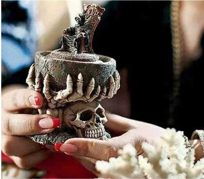
DER HEXENAUFSTAND VON BUKAREST Tod und Teufel sind Verbündete der Hexerei

Nach fast zwei Jahren Recherche (beginnend mit dem okkulten Verbrechen von Winnenden am 11. 3. 2009) kann ich mit Sicherheit sagen, dass all dies keine Zufälle sind, sondern dass das HEX-„Unglück“ ein weiteres gemeines, hintertriebenes, geplantes Verbrechen von IKOCIAM 17 (inkl. Bahn-„Insidern“) war.