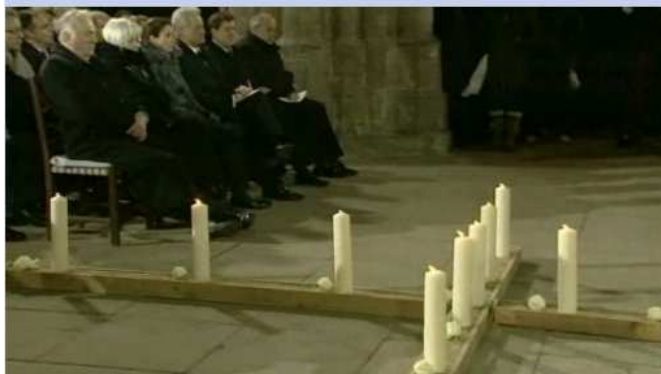
Gedenken in Halberstadt: Trauerfeier für die Opfer des Zugunglücks von Hordorf

(Von der Chorseite aus gesehen, erscheint das am Boden liegende Kreuz als Satanskreuz . Das Bild ist zudem so aufgenommen, dass die Kreuzesspitze nach unten „kippt“ und das Kreuz so für den Betrachter wie ein Satanskreuz erscheint.)