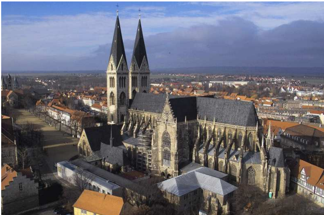
(Dom zu Halberstadt)

Schumann symphony No4-3M (3/4) Riccardo Chailly Gewandhausorchester Leipzig 25