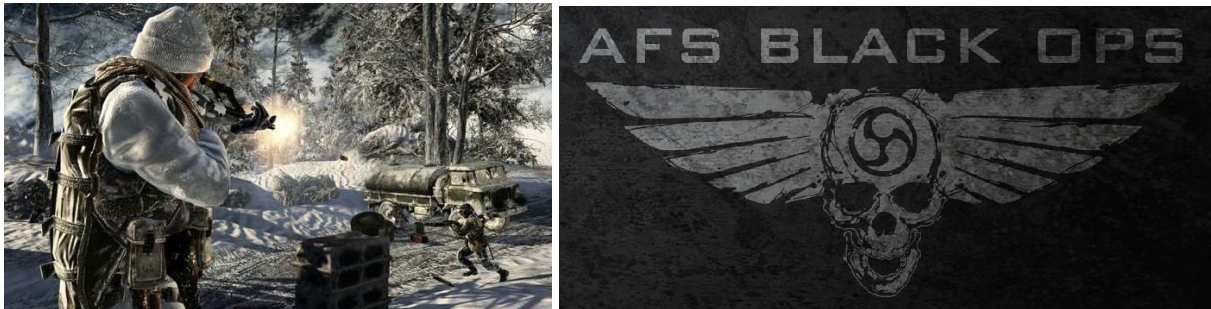
(Killerspiel Black Ops )

sechs Wochen nach dem Release ist „Call of Duty: Black Ops “ eines der erfolgreichsten Videospiele aller Zeiten und mit über einer Milliarde Dollar Umsatz das meistverkaufte Spiel 2010 5 .