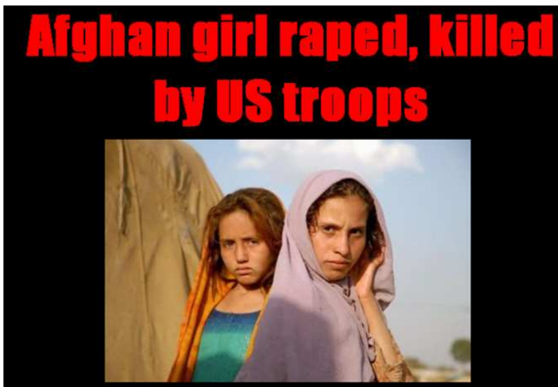
(„Afghanisches Mädchen durch US-Truppen vergewaltigt und getötet“ 9 )