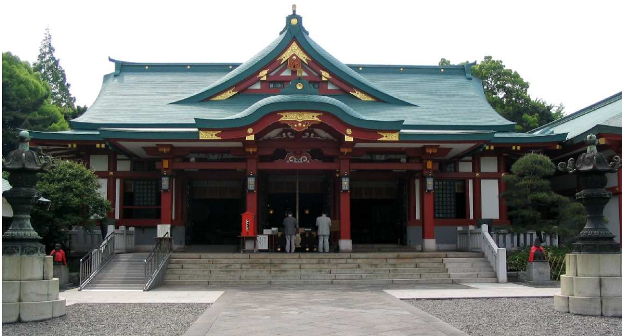
(Sanno [Hie-Shrine] Tempel in Tokio)

Aus den tiefen Wolken stößt ein Heeresbomber, setzt zum Sturzflug an, gerade auf das Hauptquartier der Rebellen zu. Die vieltausendköpfige Menge auf den Straßen und Hausdächern hält den Atem an. Ist es das Signal zum allgemeinen Vernichtungsturm auf die Stellungen der jungen Offiziere? Aber keine Sprengbomben, nur eine Wolke von Flugblättern löst sich aus den Bombenschächten und flattert wie dichtes Schneegestöber auf Hauptquartier und Postenstellungen nieder. Und wieder steht der kaiserliche Befehl auf den Blättern.