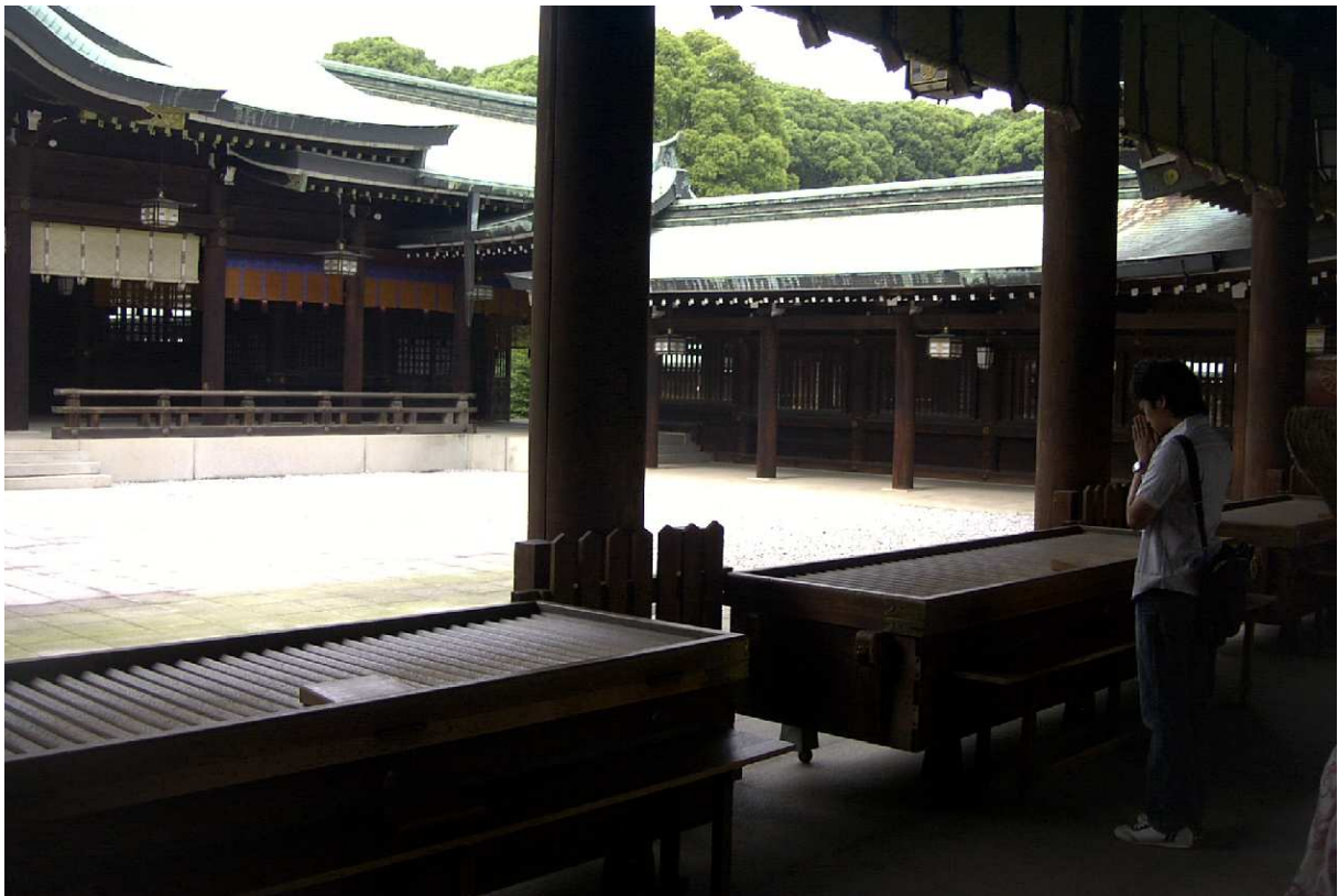
(Das zentrale Heiligtum in Tokio, wo sich der Schrein des Meij-Tenno [Kaiser] befindet)