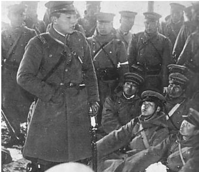
(Aufständische Truppen am 26. Februar 1936)

Die Revolte ist vorüber. Sie ohne Bruderkämpfe zwischen japanischen Soldaten beendet zu haben, war ein Meisterwerk japanisch-asiatischer Staatskunst . Es bleibt die mindestens ebenso schwere Aufgabe der endgültigen Bereinigung der Angelegenheit und die Lösung der angestauten Spannungen.