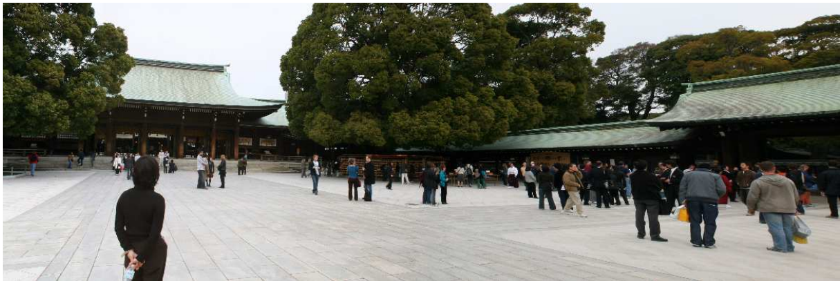
(Panorama des Meiji-Tenno-Schreins-Haupt Hof in Tokio)

Diesmal kommt die ganze faule Gesellschaft der gegenwärtigen Regierung des Ministerpräsidenten Okada (s.o.) dran, diese Kreaturen des liberalen Geistes, bis die Luft in Japan gereinigt ist für die Durchsetzung des „ Weltgesetzes der Gerechtigkeit “, des „ Ko-Do “, des „ kaiserlichen Weges “.