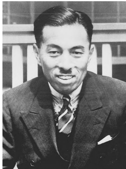
(Fürst [Konoye] Konoe Fumimaro [1891-1945])

Vor der Haupthalle des Meiji-Schreins verhaucht am selben Tag ein buddhistischer Priester sein Leben mit selbstdurchschnittener Bauchschlagader. " Weil der Majestät des Tenno Ungelegenheiten bereitet wurden ", flüstert er dem bewundernd neben ihm knienden weißgekleideten Tempelwächter ins Ohr....