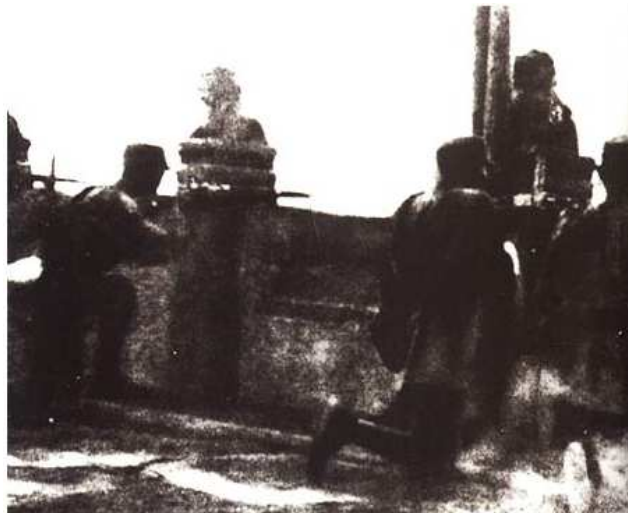
(Li: Drei Tage nach dem Zwischenfall an der Marco-Polo-Brücke verkündet Chiang Kai-shek 11 den Widerstand gegen Japan 12 . Re: Chinesische Soldaten verteidigen die Marco-Polo-Brücke)

Konoye war gegen den offenen Krieg in China, da er glaubte, Japan müsse auf die wirtschaftlichen Interessen der USA, denen Japan ein Drittel seines Exports lieferte, Rücksicht nehmen. Aber auch Konoye ließ sich von der Kwantung-Armee lange Zeit das Gesetz des Handelns vorschreiben. "Immer wieder", heißt es in einem Memorandum der US-Flotte, "haben er und seine Außenminister ihrer Mißbilligung der von den japanischen Militärs durchgeführten Aktionen Ausdruck gegeben, aber sie haben nichts dagegen getan." Immerhin sprang der Fürst ab, als Pearl Harbour in Sicht war.