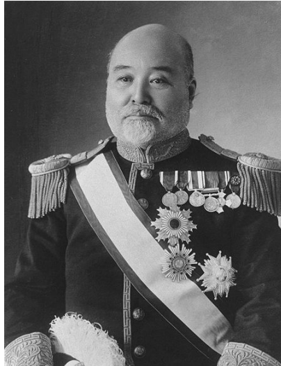
(Takahashi Korekiyo [1854-1936])

Ich setze den Spiegel -Artikel (Jahrgang 1951) zum Thema „Japan vor dem 2. Weltkrieg“ fort 4 :