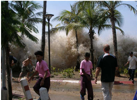
(Aufreffen des Tsunamis an der Küste Thailands)

mit ... etwa 230 000 Toten 14 . Am 26. 12. 1999 wütete der Orkan „Lothar“ 15 über West- und Mitteleuropa ( Todesopfer: 110 16 )