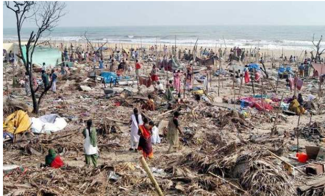
(Verwüstungen durch den Tsunami am 26. 12. 2004)

Diese vier Daten (s.o.) in Beziehung zueinander gebracht, ergibt ungefähr das „schräge Kreuz“ (s.u., links), das bei Soratisten („Satanisten“) immer wieder Verwendung findet (s.u., rechts)