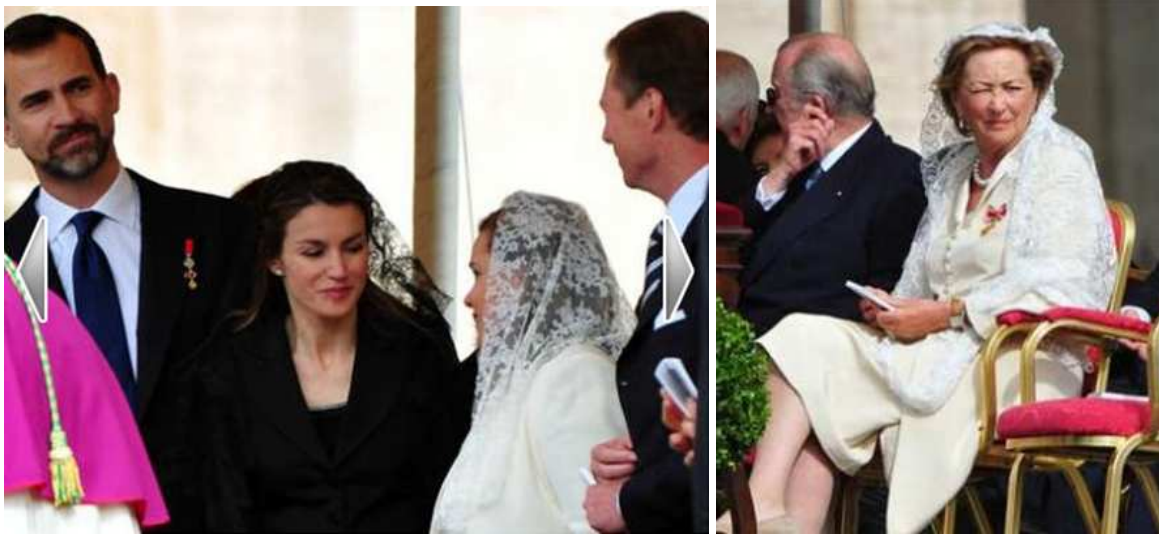
(Li: Kronprinz Felipe von Spanien und seine Frau Letizia begrüßen die Herzogin von Luxemburg. Re: König Albert von Belgien [II.] 19 und Königin Paola sitzen in einer der ersten Reihen 20 )

Natürlich durfte der „ schwarze Adel “ am 1. Mai 2011 (Illuminatenfeiertag 18 ) in Rom nicht fehlen (s.u.) – hatte dieser doch zwei Tage zuvor ein „Stelldichein“ in London.