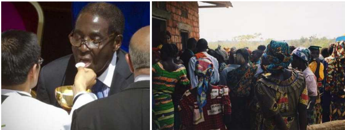
(Li: Auch Diktator Mugabe – offensichtlich verantwortlich für Massenvergewaltigungen von Frauen 21 – durfte bei der „Seligpreisung“ der logen-päpstlichen Frauenfeindlichkeit [Artikel 586, S. 1-3] nicht fehlen: Hat eigentlich Einreiseverbot in der EU: Simbabwe-Diktator Robert Mugabe. Zur Seligsprechung durfte der wegen Menschenrechts-Verletzungen kritisierte Präsident aber einreisen und auch die Heilige Kommunion empfangen 22 . Re: Bild zu Massenvergewaltigungen in Afrika [hier Kongo] 23 )