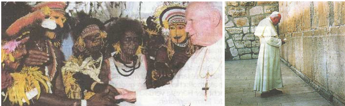
(Li: Papst Johannes Paul II. begegnete Februar 1993 Voodoo-Fetischisten in Benin. Re: Johannes Paul II. an der „Klagemauer“ in Jerusalem)

Betrachten wir das Datum 26. 6. Welche geschichtlich bedeutsamen Ereignisse spielten sich an diesem Datum ab?