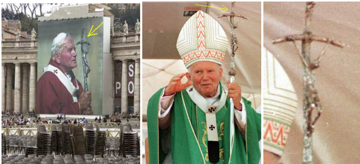
(Li: Das riesiges Bild von Johannes Paul II. mit besagtem „Kreuz“ am Petersplatz in Rom. Mitte/re: Johannes Paul II. mit dem „Kreuz“)