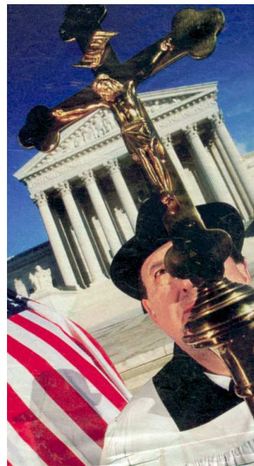
(Re: Bild aus dem Artikel „ Gott ist Amerikaner “ 17 [TV Hören und Sehen, 27/2006])

Man achte auch bei der „Seligpreisung“ Johannes Paul II. auch auf das „Kreuz“, mit dem er gezeigt wurde (s.u.) – und auf die neue „Mütze“ Herrn Ratzingers (Benedikt XVI.):