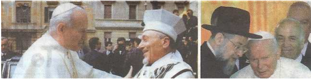
(Papst Johannes Paul II. in guter Freundschaft mit Rabbinern)

Ja, die Begründung der NWO-„Weltreligion“ am 29. 10. 1986 8 in Assisi 9 unter der Führung des Papstes (s.o.)