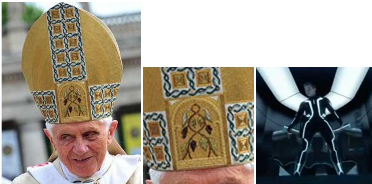
(Die neue „Mütze“ mit „Ameisen-Mensch“ von Benedikt XVI., die er am 1. 5. 2011 bei der „Seligsprechung“ Johannes Paul II. in Rom trug. Vom Gestus her hat der „Ameisen-Mensch“ eine auffallende Ähnlichkeit wie diese Gestalt [siehe rechts] im Film Tron Legacy [siehe Artikel 584, S. 3/4], auf den das Mega Ritual 2011 -Video hinweist [siehe Artikel 583/584])