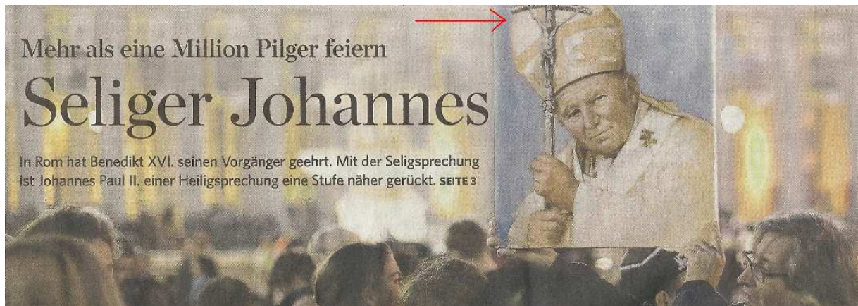
(Titelseite der Stuttgarter [Logen-]Zeitung vom 2. 5. 2011. Das „Kreuz“ drückt die ganze Verachtung der Kirchen-Logen-Oberen gegenüber dem Christus aus)