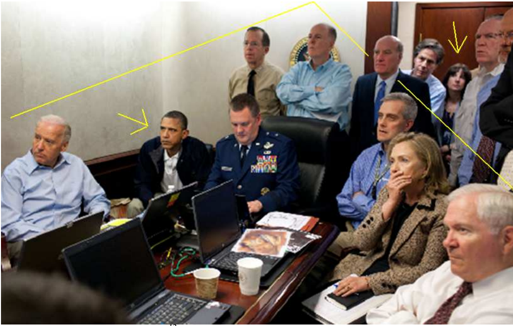
(Das nationale Sicherheitsteam 12 . Die Geraden treffen über einem Bild an der Wand zusammen – wahrscheinlich das US-[Logen-]Staatsiegel)

Schnitt. Die „Hochzeit“ von Kate Middleton und Prinz William im „schwarzen Adel“ (29. 4. 2011) weckt Erinnerungen an das tragische Schicksal von Prinzessin Diana 13 .