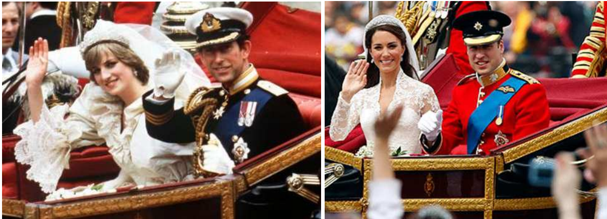
(Li: „Hochzeit“ von Diana Spencer/Prinz Charles am 29. Juli 1981 und von Kate Middleton/ Prinz William am 29. 5. 2011 [re])

Schnitt. Die „Hochzeit“ von Kate Middleton und Prinz William im „schwarzen Adel“ (29. 4. 2011) weckt Erinnerungen an das tragische Schicksal von Prinzessin Diana 13 .