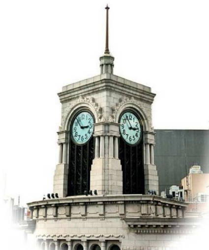
The Wako Clock tower at Ginza in Tokyo

(„ Illuminaten-Karten aus dem Jahre 1995“: Hinweis [?] auf die „dritte Atombombe“ auf Japan 17 als kombiniertes Desaster [ Combined Disaster ], also Erdbeben/Tsunami und mehrfacher atomarer Super-GAU. Das Tohoku -Erdbeben 2011 vom 11. 3. geschah um 14:46:23 18 [vgl. den Stand der Uhr oben links])