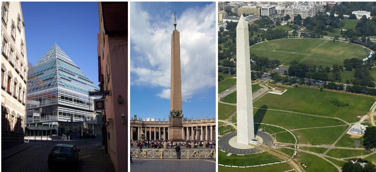
(Li: Ulmer Stadtbibliothek. Mitte: Obelisk auf dem Petersplatz in Rom, Vatikan. Re: Obelisk vor dem „Weißen Haus“. Das Washington Monument ist 169.3 Meter (555 Fuß, 5 ½ Zoll) hoch und an der Basis 16.8 Meter (55 Fuß) breit 16 .)

Die reguläre Zeit der Empfindungseele (2907-747 v. Chr.) war die Kulturepoche (u.a.) des alten Ägyptens 15 . Durch die Logen -Version der Pyramiden und Obelisken soll uns „Ägypten“ und damit die „Empfindungseele“ immer wieder vor Augen geführt werden – die „Seelenersetzung“ (s.o.) tut das ihrige.