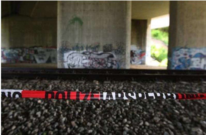
(Unfallstelle unterhalb der Autobahn A7)

Die Unterführung ist schlecht einsehbar (? 8 ), die Wände mit Graffiti besprüht. Auch andere Teenager kommen gern her. Die Polizei warnt vor der Stelle: Hier verläuft nicht nur ein Fußweg, sondern es gibt auch Bahnschienen. Die Züge fahren hier mit 110 km/h (? 9 ).