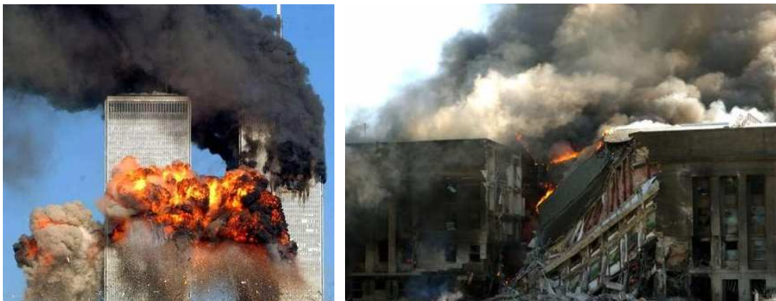
(Die CIA-Mossad-Terroranschläge New York [li]/Washington [re] unter „falscher Flagge“ vom 11. 9. 2001)

Das wichtigste Ereignis eines staatsterroristischen Anschlages "unter falscher Flagge" sind die Attentate des 11.09.2001 auf den World-Trade-Center-Gebäudekomplex mit Zerstörung mehrerer Gebäude des WTC , davon durch Sprengung und Einsturz der Gebäude in Freifallgeschwindigkeit dreier Gebäude , nämlich WTC 1, 2 und 7 sowie das Attentat auf das Pentagon , den Hauptsitz des US-amerikanischen Verteidigungsministeriums in Washington D.C. , Vereinigte Staaten von Amerika .