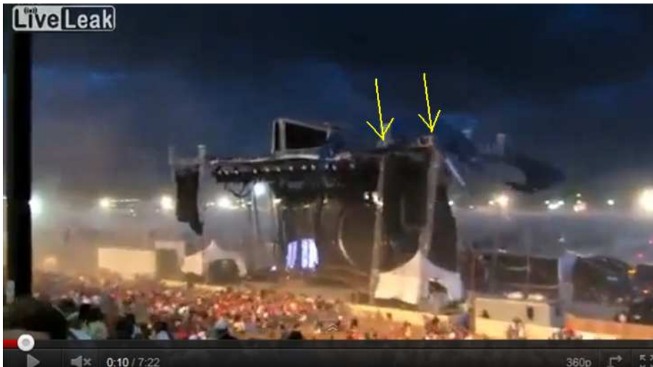
(Sek. 10: Man sieht, wie die beiden Masten parallel nach außen gehen)