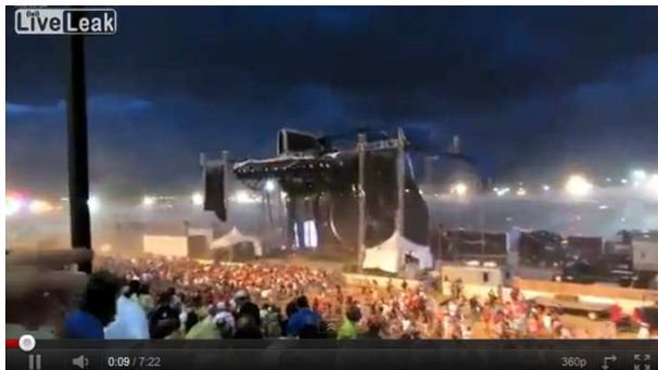
(Sek. 9: s.o.)