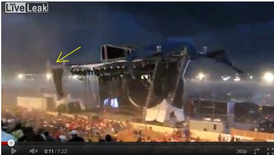
(Sek. 11: Während die Masten weiter parallel nach außen gehen [re], fällt die Trägerkonstruktion [li, siehe Pfeil] in Richtung Zuschauerbereich ...)