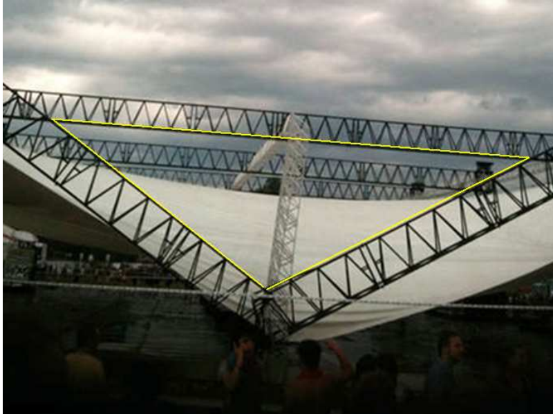
(Das eingestürzte Dach einer Bühne beim Pukkelpop-Festival in Belgien)

Indianapolis/USA (Indiana State Fair) am 13. 8. 2011 12 :