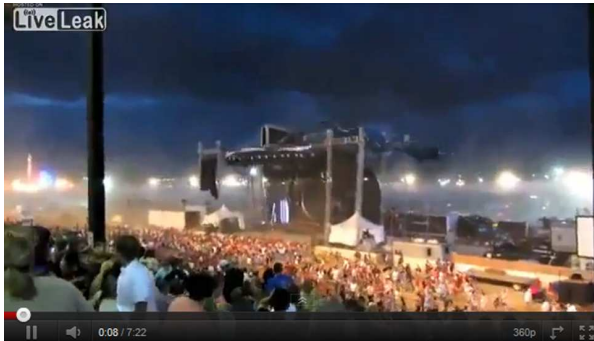
(Sek. 8: s.o.)