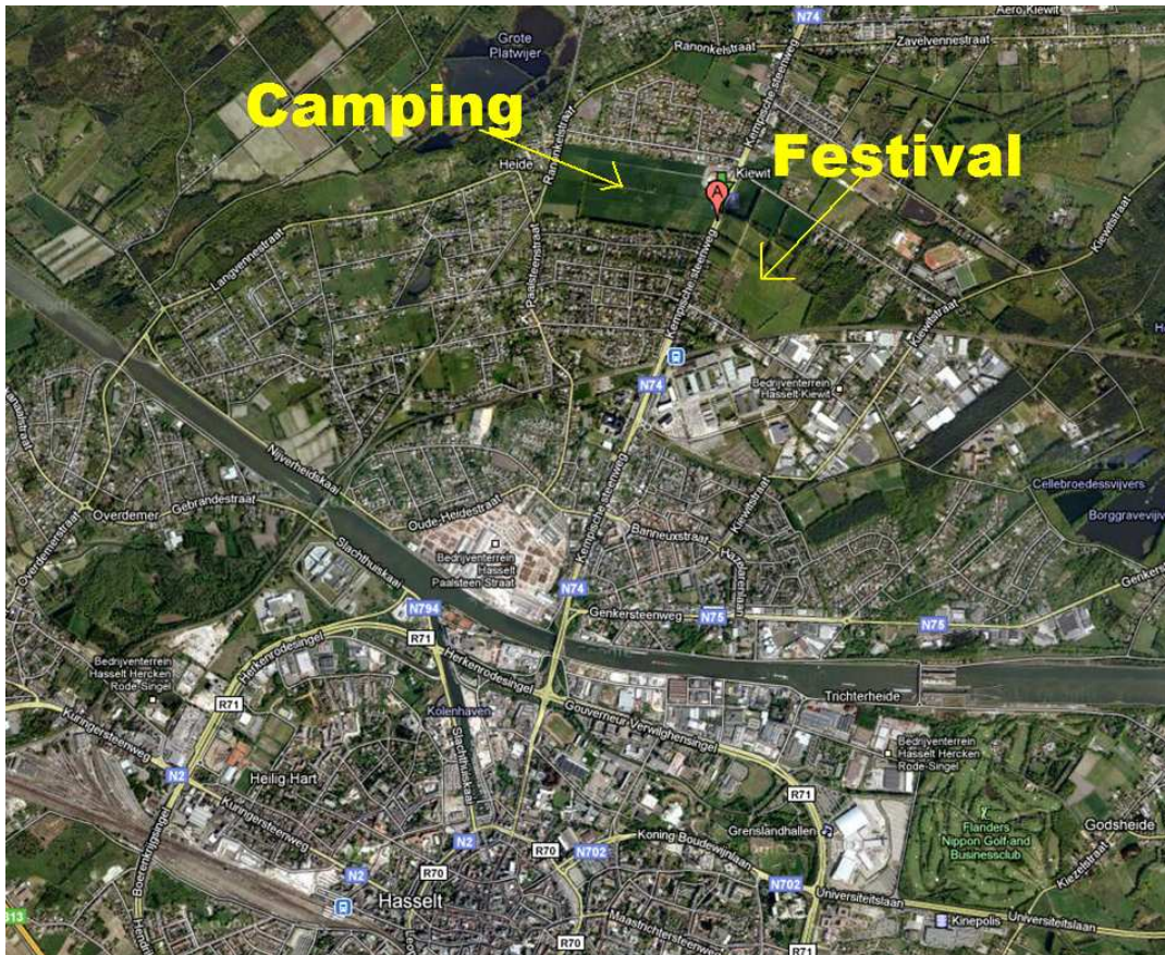
(Überblick mit Stadtkern von Hasselt)

Es gibt eine Videoaufnahme von dem Sturm aus einem privaten Zelt (Camping) 8 :