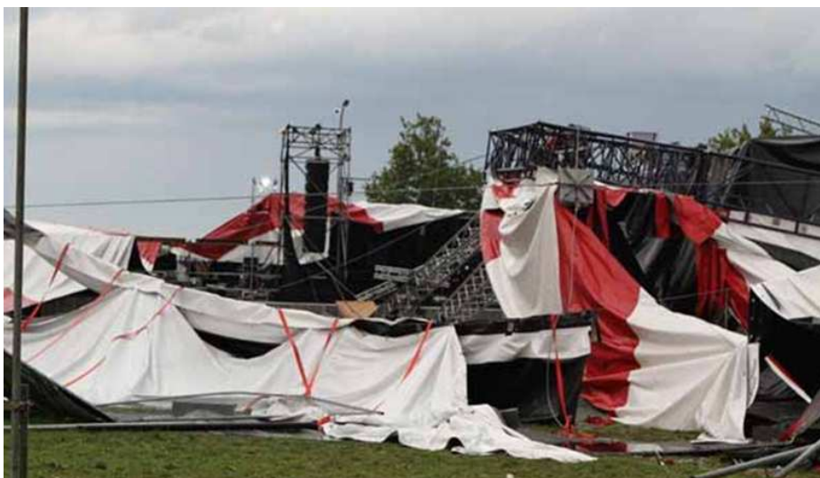
Bild.de schrieb am 19. 8. 2011 1 : Sie wollten Spaß haben, tanzen, Musik hören, feiern (vgl. „Love-Parade“ 2010 2 ) – doch für mindestens fünf Menschen endete der Besuch eines Open-Air-Festivals in Belgien tödlich. Plötzlich zog ein schweres Unwetter über das Gelände, ließ Zelte und Bühnen einstürzen (s.u.). Mindestens eine Bühne krachte auf Besucher herab...