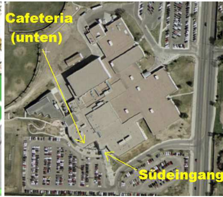
(Columbine High School – gesamt)