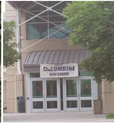
(Südeingang rechts neben der Cafeteria)