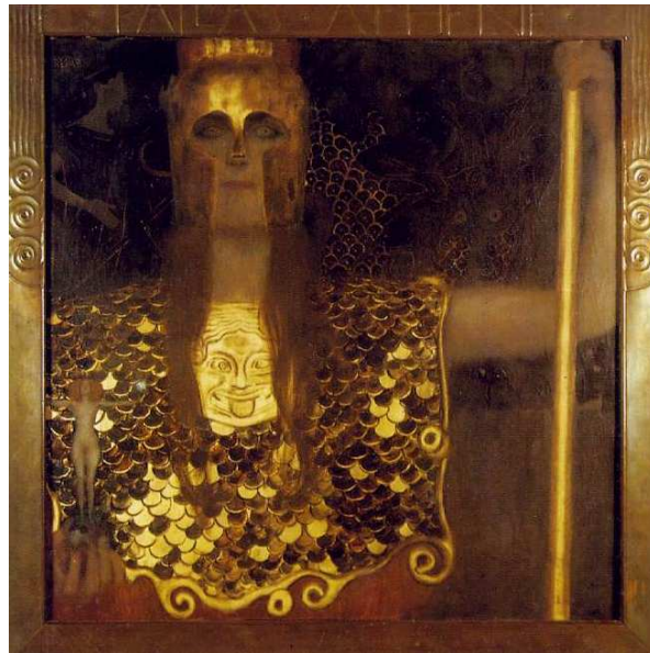
(Gustav Klimt [1862-1918], Pallas Athene)

Der Mensch muß nach mancherlei Irrfahrten , die er durchgemacht hat, sofern sie wirklich Entwicklungsfahrten sind, zum Verstande kommen. Dabei muß Pallas Athene , die Weisheit , seine Führerin sein. Das wurde dem Mysterieschüler in Griechenland vorgeführt, und das wollte Homer in der tief sinnigen Odysseus-Sage erzählen. Eine Einweihung also, wie sie damals in Griechenland gepflegt wurde, ist uns in der Odysseus-Sage dargestellt ... Odysseus ist der Schlaue , Kluge , und durch seine Fähigkeiten wurde Troja überwunden.