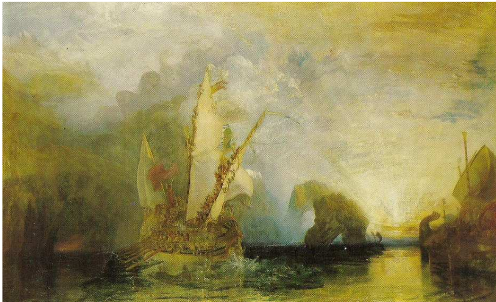
(W. Turner, Odysseus verhöhnt Polyphem )

Die Schlangen, das Symbol der weltlichen Klugheit , umgarnen den Priester Laokoon , den Repräsentanten der alten Spiritualität . Wenn Sie dies alles verfolgen, sehen Sie, daß auch in der trojanischen Sage nichts anderes festgehalten ist als ein welthistorischer Zusammenhang . In den Mysterien wurden solche Vorgänge dargestellt. In den älteren Mysterien , die den eleusinischen vorangegangen sind, wurde unter anderen gerade dieser wichtige Moment des Aufganges der vierten Unterrasse der fünften Wurzelrasse dargestellt. Der Trojanische Krieg , der ja tatsächlich stattgefunden hat, wurde in den Mysterien schon dargestellt, bevor er stattgefunden hat .