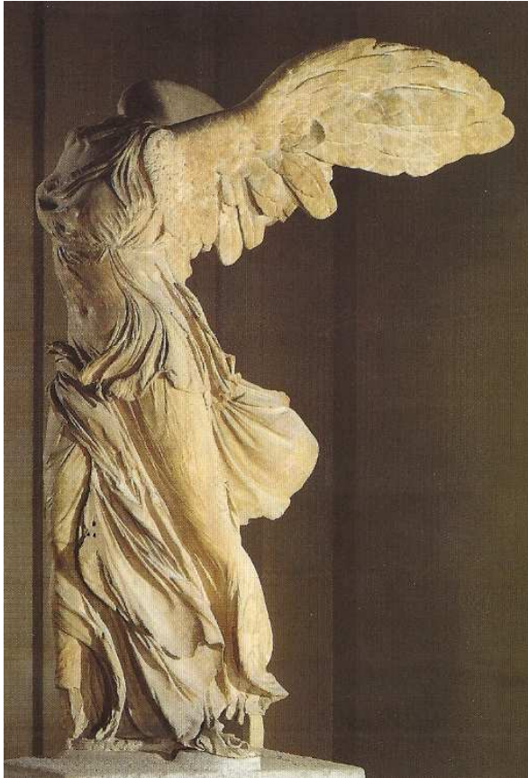
(Nike von Samothrake, Louvre, Paris)