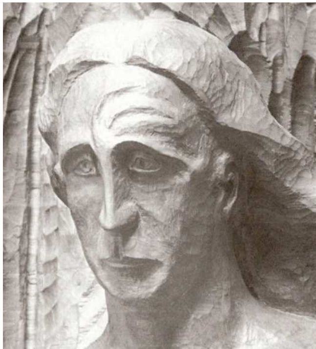
(Christus, Ausschnitt aus dem Menschheitsrepräsentanten 12 )

So schauten beide den Christus: Moses im materiellen Feuer – im brennenden Dornbusch und im Blitzesfeuer auf dem Sinai –, und es kann sich ihm nur im Innern ankündigen, daß der Christus zu ihm spricht; dem erleuchteten Auge des Paulus aber zeigt sich der Christus aus dem spirituellen, dem vergeistigten Feuer . Wie Materie und Geist zueinander stehen im Weltenwerden, so stehen zueinander im Weltengang das wundersame, materielle Feuer des Dornbusches, des Sinai, und die wunderbare Erscheinung: das Feuer aus den Wolken, das dem zum Paulus gewordenen Saulus erstrahlt . Und was ist für den ganzen Weltenwerdegang durch dieses Ereignis geschehen?