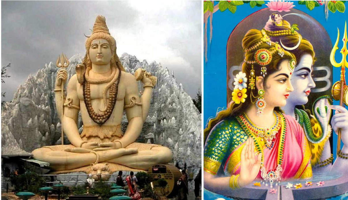
(Li: Statue des Shiva in Bangalore, Indien. Re: Pravati und Shiva. Pravati ist die Gattin von Shiva und Mutter von Ganesch. Ihr Name bedeutet „Tochter der Berge“ 7 )

auf mancherlei Umwegen auch zu dem Bewußtsein ohne Gegenstand zu kommen –, nun fragen Sie sich einmal, wenn Sie stehenbleiben bei dieser Dreiheit: Drücken sich diese drei Dinge wenigstens in ihren Offenbarungen in unserer Welt aus?