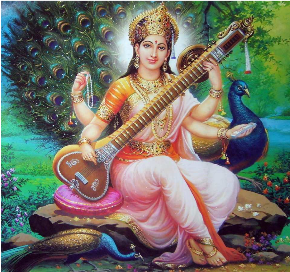
(Saraswati, die Göttin der Weisheit und Gattin Brahmas)

geweiht. Man sagte, er schlafe ein zu der Zeit des Jahres, wo wir das Weihnachtsfest feiern und erwache zur Zeit des Osterfestes.