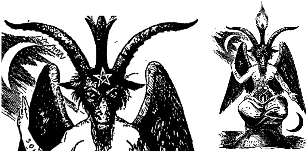
(Baphomet [satanische Wesenheit mit Ziegenkopf ] von Eliphas Levi (Abbildung in seinem Werk „Dogme et Rituel de la Haute Magie“ [1854])

Über die Insel Giglio heißt es 9 : Der Name „Giglio“ ist eine Verballhornung des lateinischen „Aegilium“ 10 , das sich seinerseits vom griechischen aix, aigos , die Ziege, ableitet: es ist also („zufällig“) die Insel der Ziegen 11 ... (s.u.).