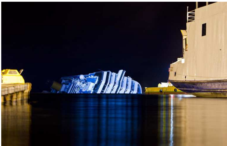
(Unmittelbar vor der Einfahrt des Inselhafens Giglio Porto liegt das Riesenschiff 12 ...)

Wie bei solchen okkulten Verbrechen üblich, werden immer neue, verwirrende Aussagen verbreitet – und auch Fälschungen 13 (vgl. Artikel 812 [S. 3/4] und 813 [S. 3/4]):