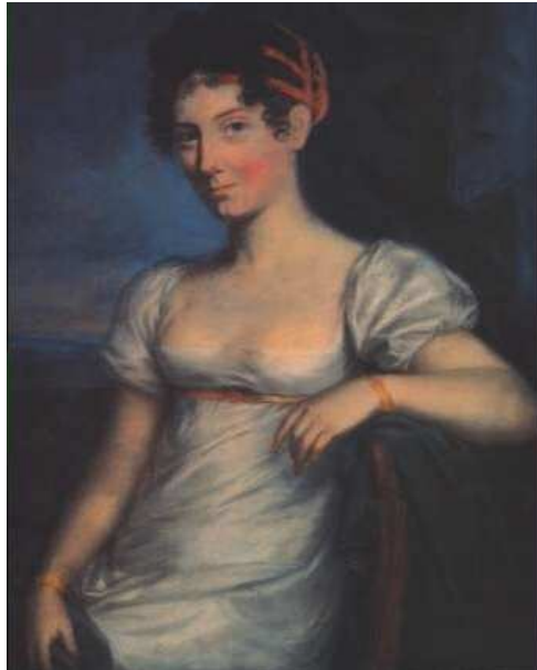
(Die Eltern Prinz Caspars: Großherzog Karl Ludwig Friedrich von Baden [1786-1818] und Prinzessin Stephanie Louise Adrienne de Beauharnais [1789-1860])

Die Ehe zwischen Karl und Stephanie war von keinem anderen als Napoleon selbst gestiftet worden 12 , der dadurch Baden in eine engere Verbindung mit Frankreich bringen wollte . Um die einfache Adlige, die Stephanie nur war, für die Ehe mit dem Sproß eines Fürstengeschlechts » ebenbürtig « zu machen, adoptierte Napoleon Stephanie , die fortan den Namen »Stephanie Napoleon« führte. Sie war nun » fülle de France «, kaiserliche Prinzessin mit dem Titel » Kaiserliche Hoheit «. Die Eheschließung zwischen Karl und Stephanie fand unter glänzendem Gepränge in Paris am 8. April 1806 statt 13 ...