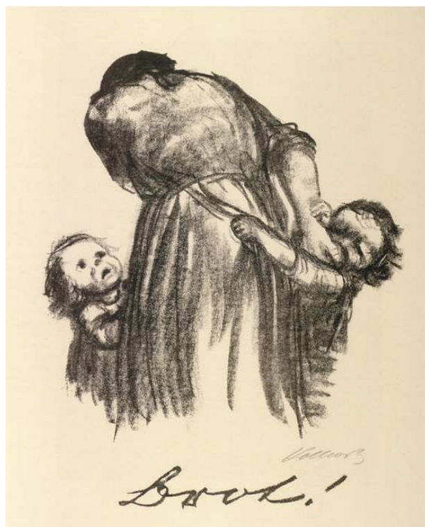
(Käthe Kollwitz [1867-1945]: Hunger [li] und Brot! [re])