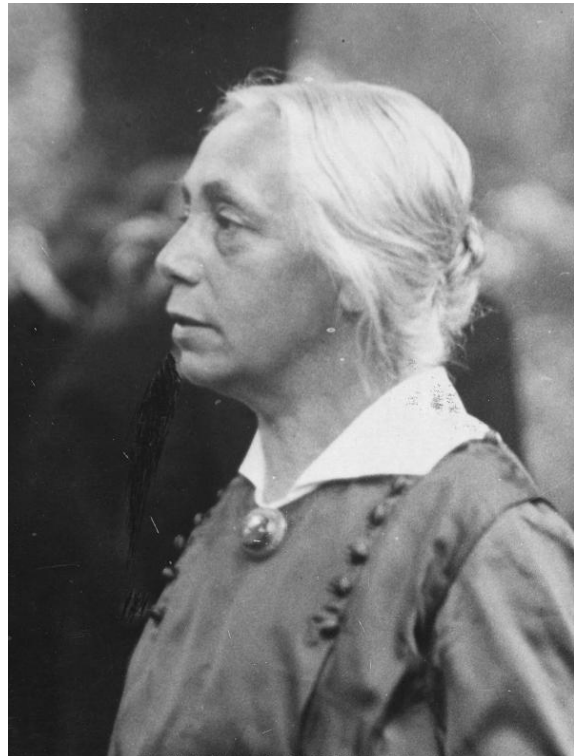
(Käthe Kollwitz, eine ausdrucksvolle, sozial-engagierte Künstlerin)