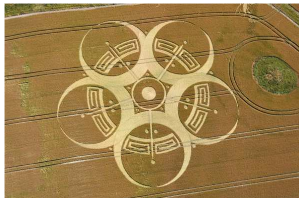
(Li: Gralsscheibe, Mexiko 1991. Re: Gralsmacht-Kornzeichen vom 25. 7. 2010, Roandway Hill, Wiltshire, GB)